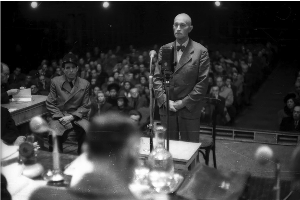
Háborús főbűnösök népbírósági tárgyalása Budapesten, 1945. Imrédy Béla korábbi miniszterelnök

tetejére állított normalitástól eltértek, akik még a normába öntött embertelenség mértékét is túllépték. 66 Látszólag abszurd módon azokat (is) felelősségre vonták, akiket a zsidókat üldöző rezsim bíróságai is büntettek. Veszprémy elismeréssel szól a királyi honvédség hadbíróóságának az újvidéki vérengzések ügyében 1944 januárjában hozott ítéletéről, amely „voltaképpen kíméletlenebb volt, mint számos háború utáni népbíróság” (182). A hadbíróóság ítéletét egyebek között azzal indokolta, hogy a vádlottak nem parancsra gyilkoltak, illetve, hogy előljáróként nem akadályozták meg az atrocitásokat, nem vetettek véget a jogtalan megtorlásnak. Szemben a Horthy-kori hadbíróóság verdiktjével, egyetlen háború utáni bírósági ítélet sem róttá fel a vádlottaknak – írja Veszprémy –, hogy nem léptek fel aktívan az üldözöttek védelmében (183). Igen, a Horthy hadbíróósága szigorúan büntette azokat, akik nem a terveknek megfelelően, nem a parancsban írtak szerint, hanem saját kezdeményezésre, egyéni motívumoktól hajtva üldözték a zsidókat. De azzal, hogy az önkényesen vérengzőket megbüntette, nem az üldözöttekkel való szolidari-