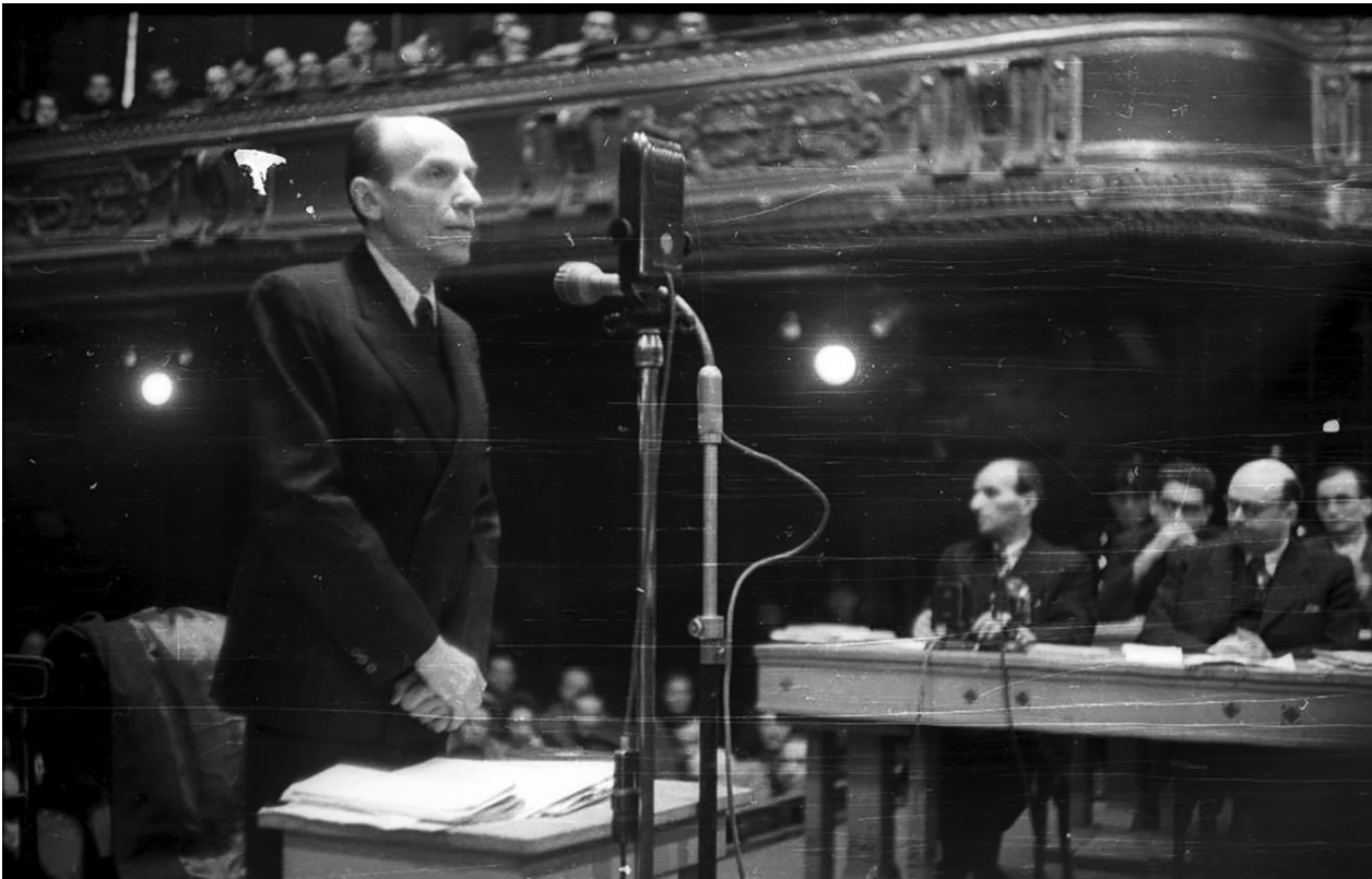
Imrédy Béla volt miniszterelnök a népbíróság előtt (Budapest, 1945.)

Hóman levelében a németeket a magyarok természetes társának minősíti a nyugati kultúrközösségben, 6 azért árulkodik a „megszállás” sajátos jellegéről.) Ha a Turul bajtársak vagy Hóman megszállásnak minősítették is a német jelenlétet, nyilván üdvözölték a zsidók eltávolítását célzó kezdeményezésüket. Így nem tekintették nemzetárulásnak, ha ebben a magyar közigazgatás segítkezik. Maguk a közszolgák sem gondolták – leszámítva a jelentéktelen kisebbséget –, hogy a nemzet érdeke azt kívánná: a passzív ellenállás eszközeivel, a hagyományos nem-tevéssel, halogatással akadályozzák vagy akár késleltessék a zsidók megsemmisítését. A zsidókat sújtó fokozatos kirekesztés, lépcsőzetes jogfosztásuk azt jelezte számukra, hogy a zsidók nem részei a megmentendő nemzetnek .