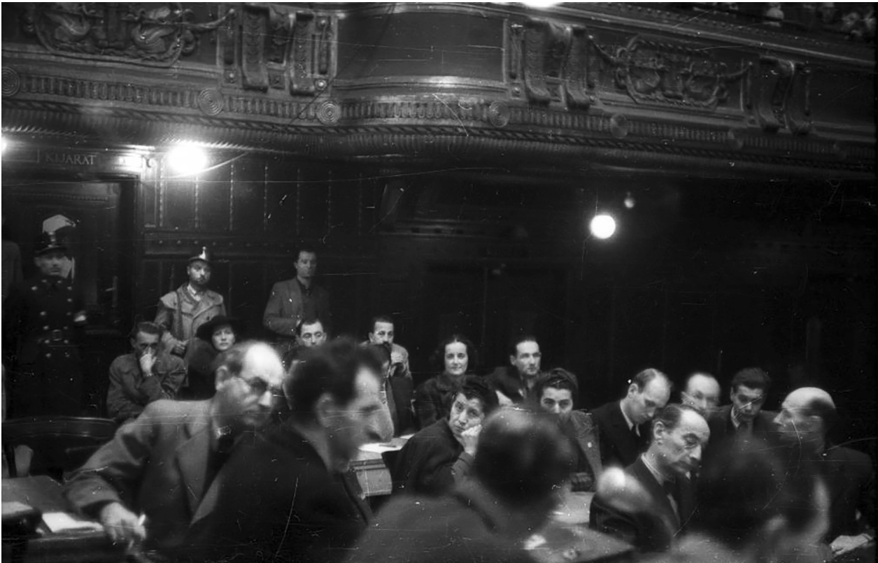
Háborús főbűnösök népbírósági tárgyalása Budapesten, 1945