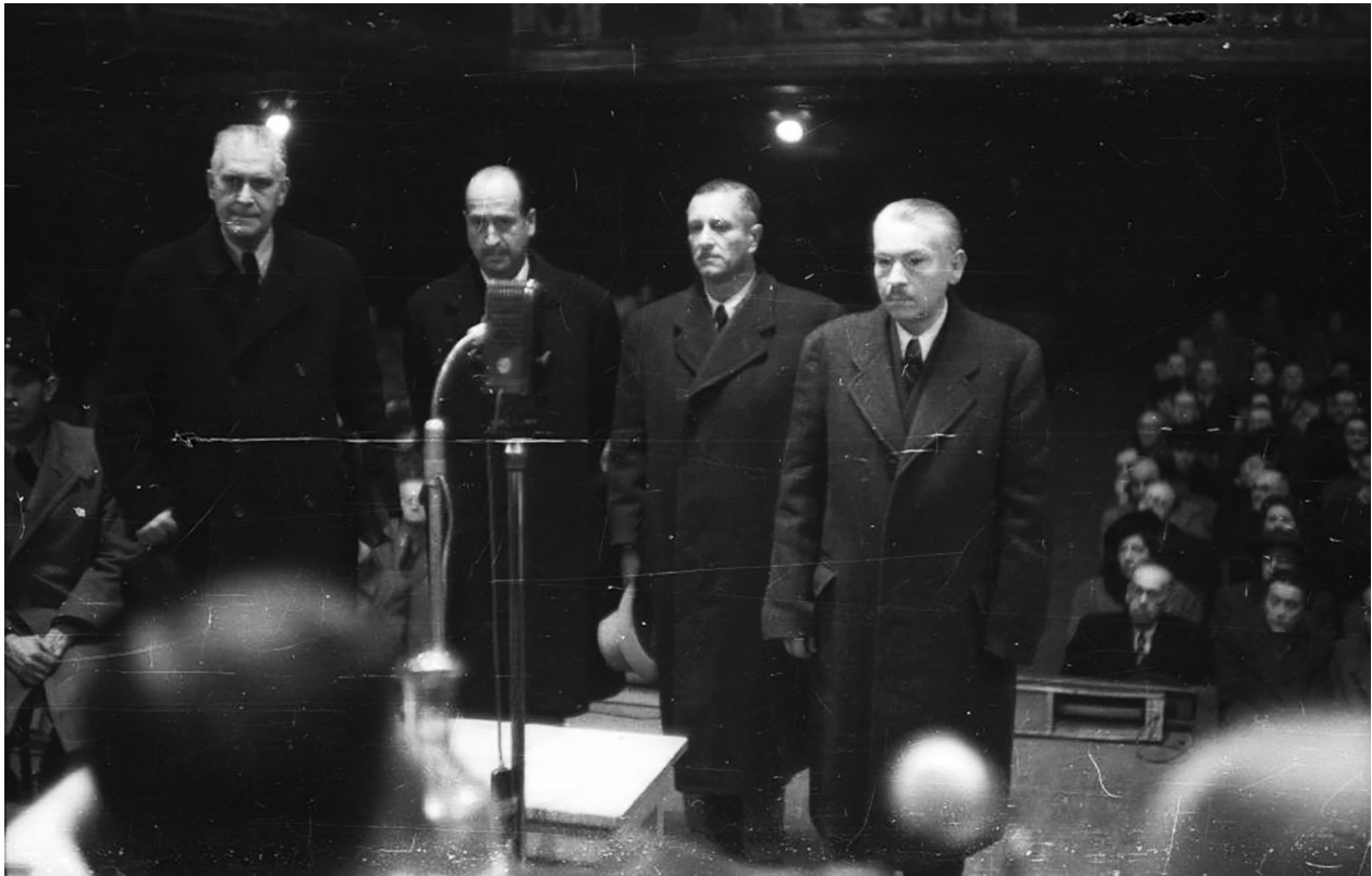
Háborús főbűnösök népbírósági tárgyalása Budapesten, 1945

pusztultak amúgy sem bírtak volna ki), azzal, hogy a célállomásra élve érkezőkre a lassú halál vár. 50 Saját brutalitásuk – az úgy nevezett „pénzverde”, a zsidók – esetenként halálos kimenetelű – megkínzása vagyonuk megszerzése érdekében (149–150) –, a vagonírozás embertelensége, közvetlenül előtte pedig a zsidók személyi okmányainak a megsemmisítése mind mellett szól, hogy tisztában lehettek a németek népiirtó szándékával. (Tudjuk, hogy a náci vezetés terve az európai zsidóság megsemmisítése volt. De ha a közszolgák csak arról tudtak, aminek kivitelezésében ők maguk közreműködtek, azaz a magyarországi vidéki zsidóság kiirtásának szándékáról, úgy ez önmagában megalapozza bűnsegédi felelősségüket a népiirtás büntetében. A népiirtó szándék irányulhat ugyanis a csoport egy – igaz, jelentős – részének vagy pedig meghatározott földrajzi területen élő valamennyi tagjának megsemmisítésére. 51 A németek szándéka a Magyarországon élő vidéki zsidóság kiirtására – erről tudhattak a közszolgák – mindkét kritériumnak megfelelt.)