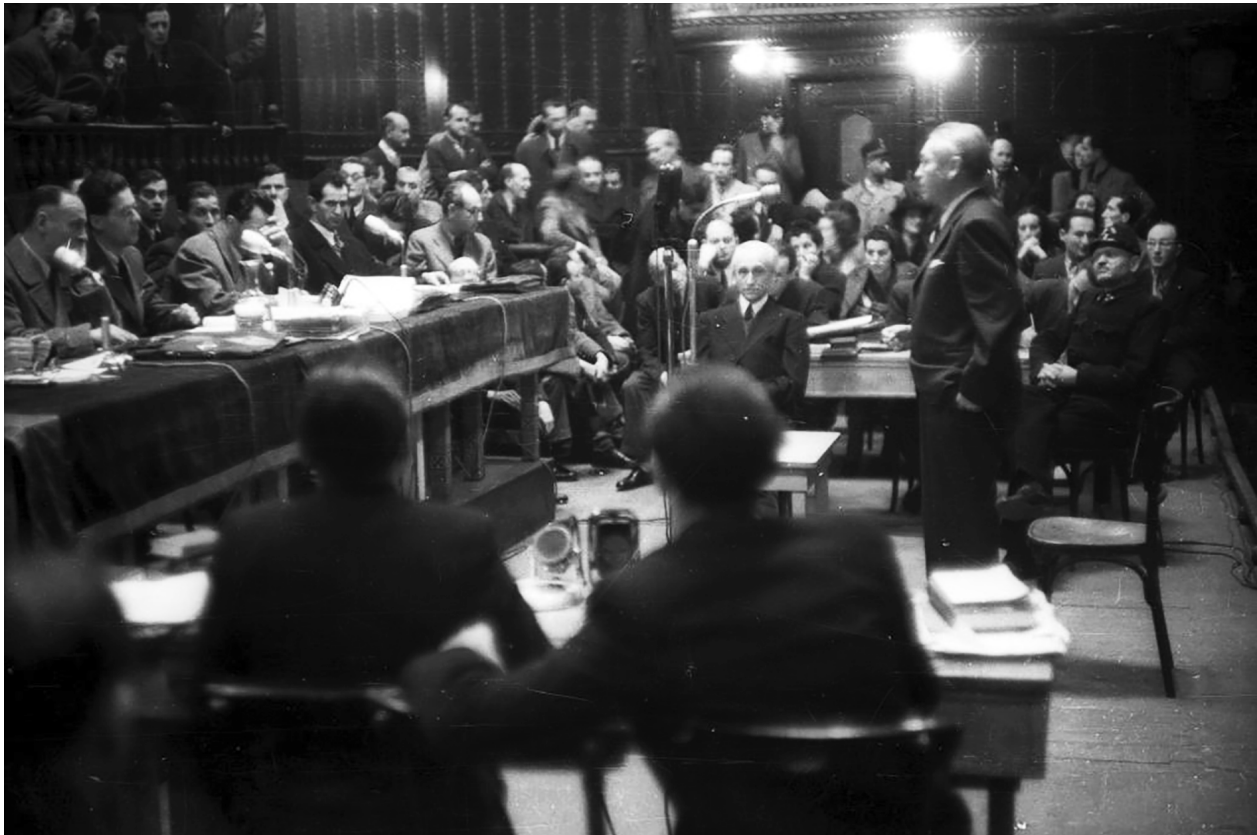
Háborús főbűnösök népbírósági tárgyalása Budapesten, 1945. Szemben, középen ül Bárdossy László korábbi miniszterelnök

ahogy azok a büntető anyagi jogszabályok sem, amelyek alapján ítéleztek. Pusztán megjelöli a népbíráskodás tárgyában kibocsátott kormányrendeletet, megállapítja, hogy a népbíróságok „korábban nem ismert fogalmakat is bevezettek a magyar jogba” és hogy „visszamenőleges hatállyal is ítéleztek” 61 (171). Bár éri emiatt szemrehányás, 62 Veszprém közönye a joganyaggal szemben védhető. Nem a jogi rendelkezések elemzését ígérte, hanem azt, hogy bemutatja: milyen stratégiát követtek a perbe fogott közszolgák; miképp igyekeztek menteni magukat, hogyan számoltak el bírálók előtt és önmaguknak bűneikről, arról, hogy erkölcsileg csődöt mondtak (169). Mégis, a népbíróságokról szóló törvény ismeretében Veszprém nem bírálta volna a békéscsabai bíróságot, mert az megróttta a város polgármesterét, amiért nem teljesítette a keresztény házastárssal élő zsidók mentesítéséről szóló belügyi rendeletet. Eszerint – írja Veszprém – „a kollaboráns kormány által hozott [...] törvényeket be kellett volna tartani, ha azok a zsidók helyzetét mérsékelték”. A békéscsabai bíróság ezzel – vonja le a következtetést Veszprém – „némi legitimitást is