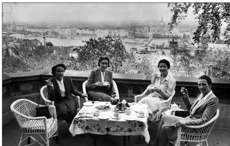
Teázó hölgyek a volt brit követség teraszán (1940-es évek)

Hohler hasonlóan hasznosnak bizonyult a két királypuccs során, 1921 márciusában és októberében. A nagyhatalmakat tekintve az Egyesült Államok az első királypuccsal kapcsolatban távolságtartó álláspontra helyezkedett. 57 A budapesti nagyantant külképviseletek március 28-án – IV. Károly fővárosból való távozása után – értesültek a királylátogatásról. Végül csak Hohler járult Horthy elé, akitől a kormányzó menlevelet kért a király számára. Itt érdemes jelezni, hogy Károly ekkor még Magyarországon tartózkodott, és a tárgyalások még folytak közte és a kormány között, így elmondható, hogy Horthy valószínűleg nem akarhatott semmilyen eredményre jutni, ha a tárgyalások lezárásra előtt