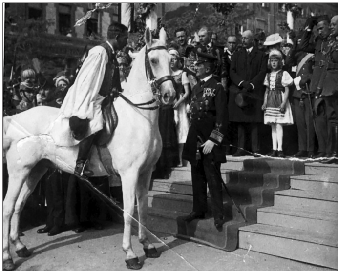
Horthy Miklós 1921-ben Pécsen

Hohler tevékenysége budapesti szolgálatának első két évében meghatározónak tekinthető. Fontos szerepet játszott az 1921-es év számos lényeges eseményében, így – egyenesen meghatározó szerepet! – a baranyai bevonulás korai időpontjának meghatározásában, a brit kormány félretájékoztatójában a nyugat-magyarországi eseményekről, illetve a két királypuccsban. Vezetése alatt továbbá a brit követség konzekvensen félretájékoztatta a brit kormányt és a brit zsidóság képviselőit a magyarországi fehérterror mértékét és jellegét illetően. Hohler ellenségesen viseltetett a galíciai zsidó menekültekkel, kitelepítésüket meg sem kísérelte nyomással akadályozni vagy lassítani. Zsidó követségi alkalmazottjától egyértelmű antiszemita motivációkból