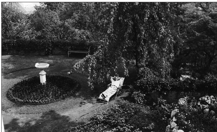
A korábbi brit követség kertje (1943)

keresztényektől elválasztva viszik őket a határra, ennek csak az az oka, hogy az ortodox „szokásrend szerint nem lehetnek közel keresztényekhez”. A levél többi része is megcáfolta az atrocitáshíreket: igen, a vagyontárgyaikat elvették tőlük, de a híresztelésekkel ellentétben legalább nem adták el őket. Nem, az internálótáborok valóban nem jó helyek, de a zsidókat nem oda viszik, hanem Csehszlovákiába. A sajtóban jelentett pogromhíreknek is utána jártak, de pogromok nem történtek. Athelstan-Johnson végül felszólította a londoni közösséget, hogy ne üljenek fel a rémhíreknek, mert így csak rontanak a magyar zsidók sorsán. 14 A hitköztség nem fogadta meg a brit diplomaták tanácsát. 1922 tavaszán arról tájékoztatták Lucien Wolfot, hogy 20 ezer magyar zsidót készülnek deportálni. „Ez egy pidjon svujim [túszok megváltása] a szó legszorosabb értelmében”. 15 A Board of Deputies tagjai 1923-ban is számon kérték Szapáry László gróf londoni magyar követen a deportálások hírét, aki úgy felelt, hogy „néhány orosz bolsevistát deportáltunk”, de minden egyéb hír „tévedés kell, hogy legyen”. 16