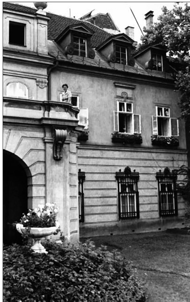
A korábbi brit követség kertje a budai Várban (1943,)