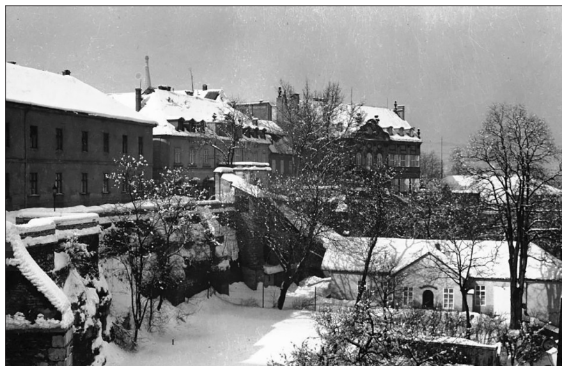
Kilátás a Halászbástyáról a brit követség korábbi épületére (1943)