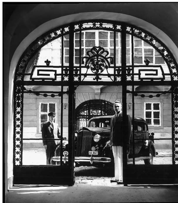
A korábbi brit követség udvara, a kapuban Carl Lutz svájci diplomata (1943)

be volt fagyva, és az ég nehéz felhőkkel volt beborítva, melyek az amúgy gyönyörű és étellel teli királyi palota épületének szinte sötét és elnyomó hatást adtak. A város maga természetesen nem szenvedte meg a háború hatásait, hiszen a harcok nem érték el házait, azok megtartották régi előkelőségüket. De a lakosság nagyon rossz helyzetben volt. Nagy étel-, szén- és benzinhiány volt, a fizetőeszköz értéke megállíthatatlanul zuhant, és a lakosságot számtalan menekült duzzasztotta fel, főleg lengyelországi zsidók és a határok[on túli] területek lakosai, [továbbá] nagy ruhahiány, inség és nyomor volt. Alig értem el hoteletem, mikor [...] legnagyobb örömömmre megtudtam, hogy [...] az én régi barátom, Horthy [Miklós] lett Magyarország kor-