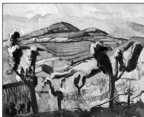
4. Vörös földek Arcugnano mellett. 1930 k. olaj, vászon, 50 × 60 cm. Magántulajdon