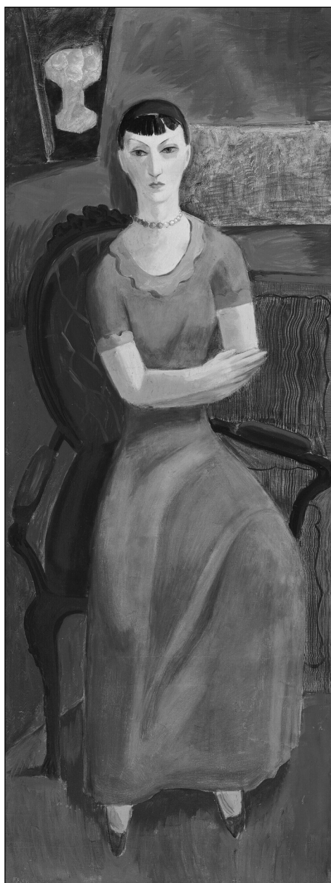
2. Flóra (Piros ruhás nő). 1933, olaj, vászon, 177 × 66 cm. Magántulajdon. A Flóra-sorozat egyik darabja

MUTHER Richard, A festőművészet története , Budapest, Révai Testvérek, 1920.