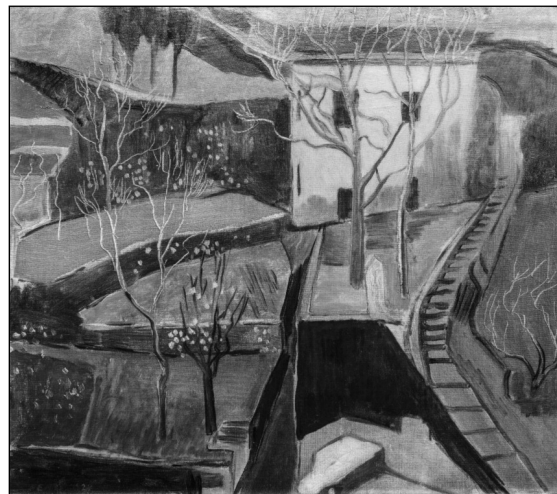
5. Világoskék ház szürkületben. 1929, olaj, vászon-karton, 54,7x60 cm