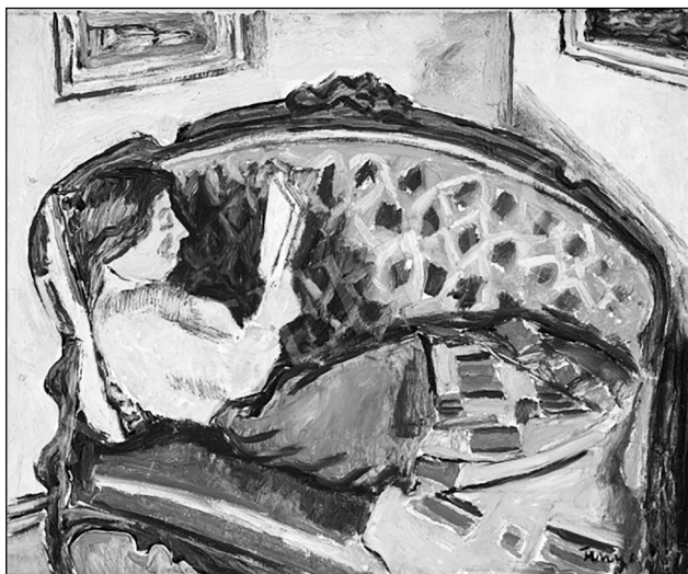
3. A kék kanapé. 1937, olaj, vászon, 50x59 cm