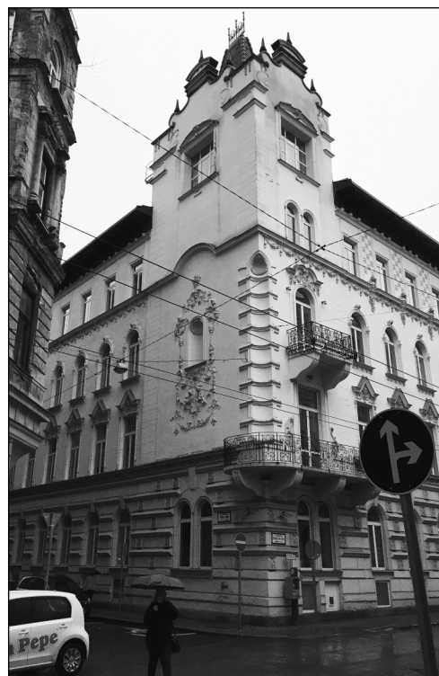
6. A Kálmán Imre utca 19. számú ház jelenleg, melynek tornya 1944-45-ben a képeket rejtette