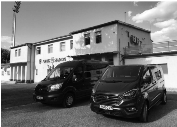
A pápai Perutz Stadion bejárata napjainkban

A Perutz cég csehszlovákiai gyárai elkezdtek a