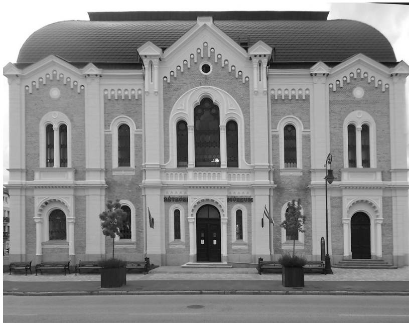
Kisvárd, Zsinagóga, 2017

amelynek során az előbbi három országot dicsérte az utóbbi rovására. Például sokkal szabadabbnak érezte a légkört Varsóban, mint Moszkvában, a varsói repülőteret tisztábbnak tartotta, mint a moszkvait, ahogy a budapesti Royal Szállóban is színvonalasabb volt a kiszolgálás, mint a Hotel Ukrajnában. 40 Katz negatív véleménye szoros összefüggésben állt azzal, hogy a B'nai B'rith 35 fős delegációjának szovjetunióbeli utazása egyértelműen csalódással végződött. A zsidó vallási élet láthatóan visszaszorult, ugyanakkor a páholy elnöke hiába emelt kifogást amiatt, hogy körülbelül 1000 jiddis nyelvű iskola zárt be a korábbi években, ami félmillió embert megfosztott az anyanyelvi oktatás lehetőségétől. A szovjet kulturális minisztérium és a vallási ügyekért felelős hivatal vezetői váltig azt hangoztatták, hogy „a probléma nem létezik”. 41 Katz Fülöp hangsúlyozta, hogy a szervezetük nem óhajt beavatkozni a kelet-európai országok politikájába, mindössze az ottan élő zsidókat szeretné közelebb hozni a világ zsidóságához, hogy megismerhessék és segíthessék egymást. A közös pontok keresésének jegyében megszelleztette, hogy a B'nai B'rith vezetői rokonszenveznek egyes baloldali gondolatokkal. Katz ugyanakkor azt állította, hogy jobban ismeri a marxizmust, mint a magyarországi párttagok többsége. Gajda úgy vélte, hogy még ha cionista felfogásával nem is lehet egyetérteni, Katz nem ellenséges a szocialista rendszerrel szemben. 42 Borsányi Imre rendőr őrnagy (fn. „Szántó”), az angol-