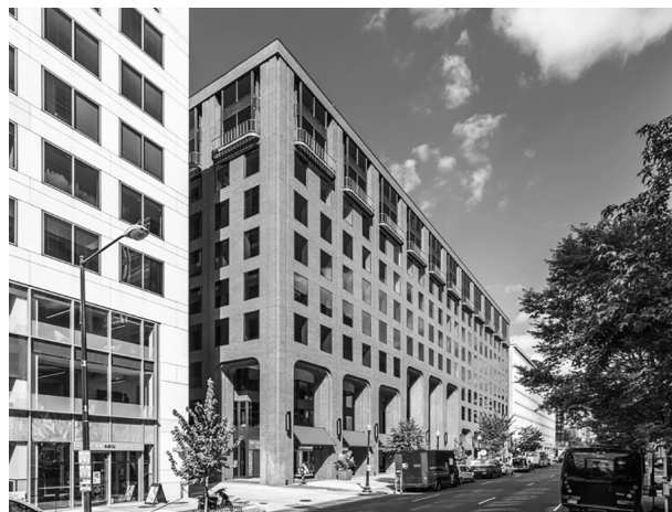
B'nai B'rith székház, Washington