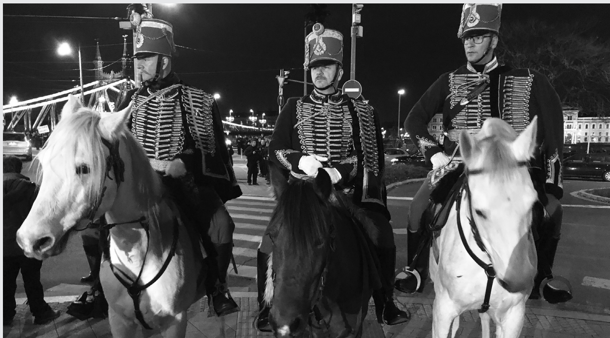
Vissza Horthy Lovasszobrát! – tüntetés, Gellért tér (volt Horthy Miklós körút eleje), 2019. november 16.