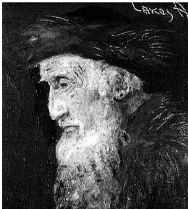
Lakos Alfréd: Rabbi-portré

a Nyolcak és kritikusaik közötti szemléleti ellentét figyelemre méltó dokumentuma Lakos Ki ért a festészethez? című cikke, mely a Budapesti Napló 1911. március 21-i számában jelent meg. „Egy gyönyörű épületről, egy gyönyörű vagy rút festményről, egy szép költeményről vagy egy ultramodern vers-őrületről mindenkor szabad is, illik is vagy kötelességszámba megy nyilatkozni annak, akinek szava, úgy látszik, nagyon messzire elhallatszik, mert nagyon fáj.” a Magyar Figyelő című folyóiratban az alábbiakat írta a forradalmi kifejezési formákat kereső festőtársairól: „Egész sereg rajzot és festeni tudást megvető ecsetkezelő árasztja el tarkabarkára mázolt vásznaival a budapesti modern kiállításokat, s rohanja meg a szegény vidék naiv közönségét... Minden négyszögméter vászon és minden kilogramm festék, mely teremtő dühük martalékául esik, az igaz művészet szolgálatában pusztul el, mert a jó ízlés egészséges feltámadását csak siettetheti.” 20