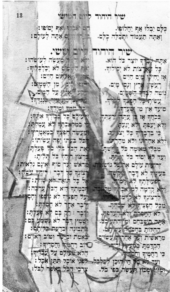
Napló, zsidó imakönyv lapján

át az a ki nem mondott (ki nem mondható, csak festhető) tudás, ismeret, amit gyakran azonosnak érzünk a sajátunkkal: valami „kollektív tudattalan”, a létezés tragikumának átérzése. Mózes Kati 1990 előtti munkáiban valamivel nyíltabban tárgyiasult a szorongás, a lét abszurditásának érzete: megjelenített gnómok, szörnyek formájában. Innen az út kétfelé vezethetett. Az egyik út a figurális festés még nyíltabb, tudatosan vállalt formája volt, a holokausztban elpusztított egykori testvérek képének felidézése, a családi és történelmi múlt mintegy belső adósság törlesztéseként való megjelenítése. Ezekről a képekről fellebben a titokzatosság fátyla, a lélek mélyen honoló nyomasztó életérzés, szorongás magyarázatot kap; egyszersmind segít a párhuzamosan létező másik út , a jellegzetesen nonfiguratív, sokkal ösztönösebb irány érzelmi-indulati indítékának felfejtésében. (Mindkét út találkozik Mózes Kati