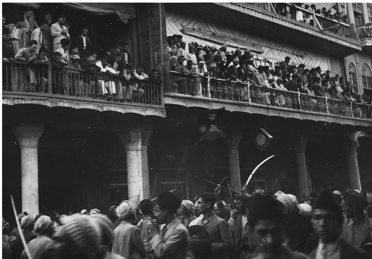
Bagdadi tömeg 1941. június 2-án, az ún. farhúd idején

A brit hadsereg Bagdad kapujában állt a tömeg-gyilkosságok két napja alatt, és bár tisztjeiknek tu-domása volt az ott zajló eseményekről, tartózkodtak a városba való belépéstől addig, amíg a pogrom véget nem ért. Éppen emiatt sokan firtatták a britek