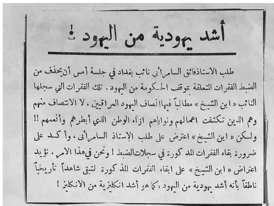
Zsidóellenes propagandairás egy korabeli iraki újságban

Amint az a The Australian Jewish News fentebb közölt jelentéséből is kiderül, a zsidó állampolgárok kimenekítése valóban komoly gondot okozott az iraki hatóságoknak. A zsidók áttelepítésében a cionista szervezetek is hathatósan közreműködtek. Már 1948-tól, Izrael Állam megalakulásakor elkezdtek titokban szállítani az iraki zsidókat. Az iraki kormány minden erejével üldözte a cionista szervezeteket, aminek elsődleges oka az volt, hogy a zsidó lakosság kicsempészésével a pénzüik is kikerült az országból, jelentős károkat okozva ezzel Irak gazdaságának. 29 A zsidók kimenekítésére reflektál az Al-Jakza című lap 1950. február másodikán közölt cikke is: