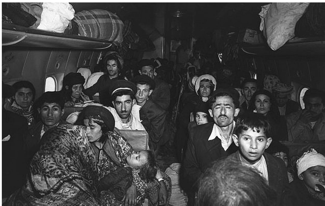
Az iraki zsidók szervezett szállítása Izraelbe

gi érdekei miatt lemondott saját, 2600 éve a területen élő közösségről.