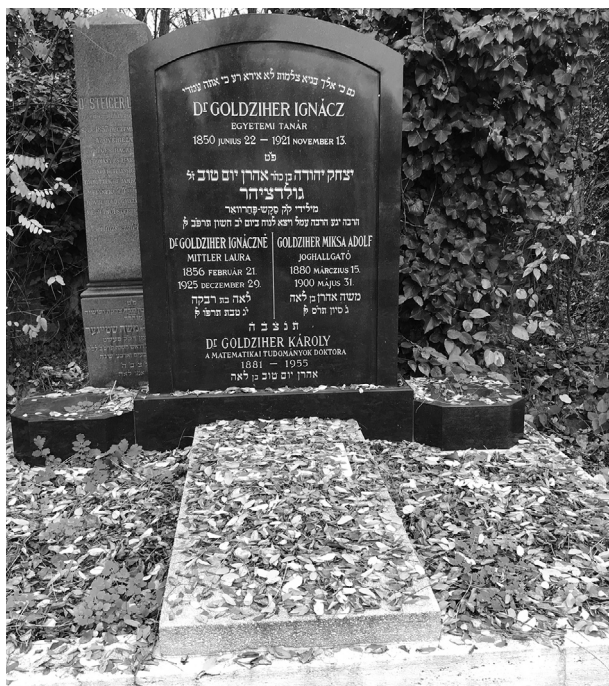
Goldziher Ignác és családja sírja 2022. november 9-én