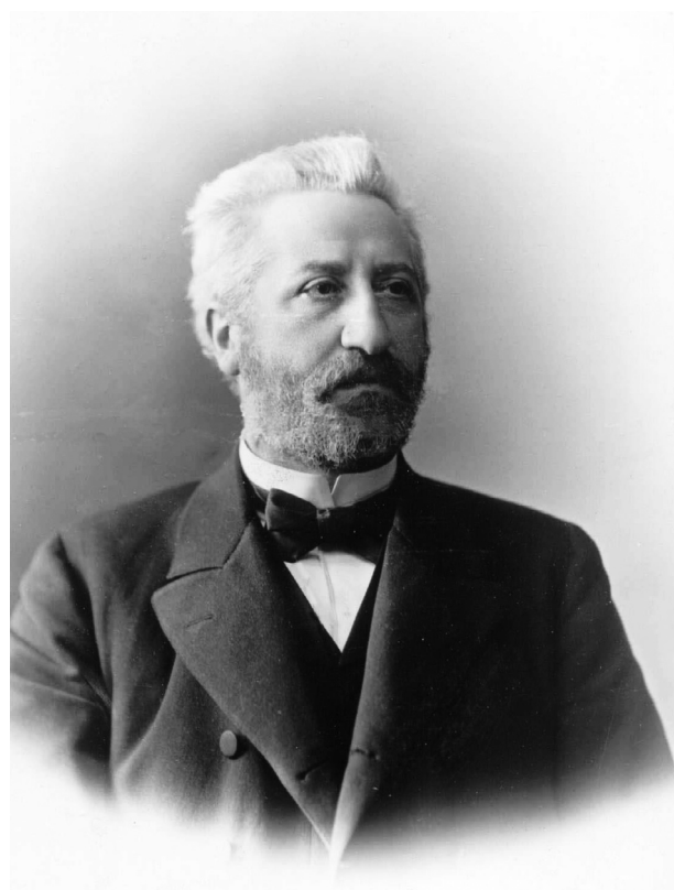
Goldziher Ignác portréja (készült Pesten, Excelsior Fényírda)

A Magyarországon született, és kora ifjúságát Budapesten töltő, majd Párizsban befutott orvos, író, újságíró és cionista Max Nordau (1849–1923), valamint a Bécsben színpadi szerzőként és a Neue Freie Presse munkatársaként, majd a Der Judenstaat révén ismertté vált Theodor Herzl kapcsán korábban már megvizsgáltam az asszimiláció, a nyelv és az identitás szerepét pályájuk alakulásában. 1 Jelen tanulmány ezt a gondolatmenetet kívánja tovább vinni, középpontjában a Nordaival együtt induló Goldziher Ignáccal (1850–1921), a későbbi modern európai iszlámkutatás megalapítójával, akivel a reformá-