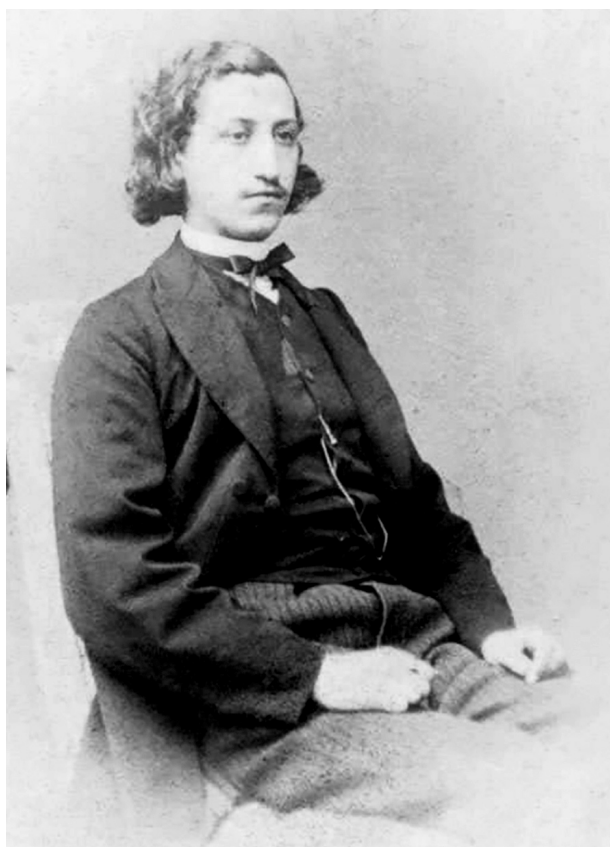
Goldziher Ignác egyetemistaként Lipcsében