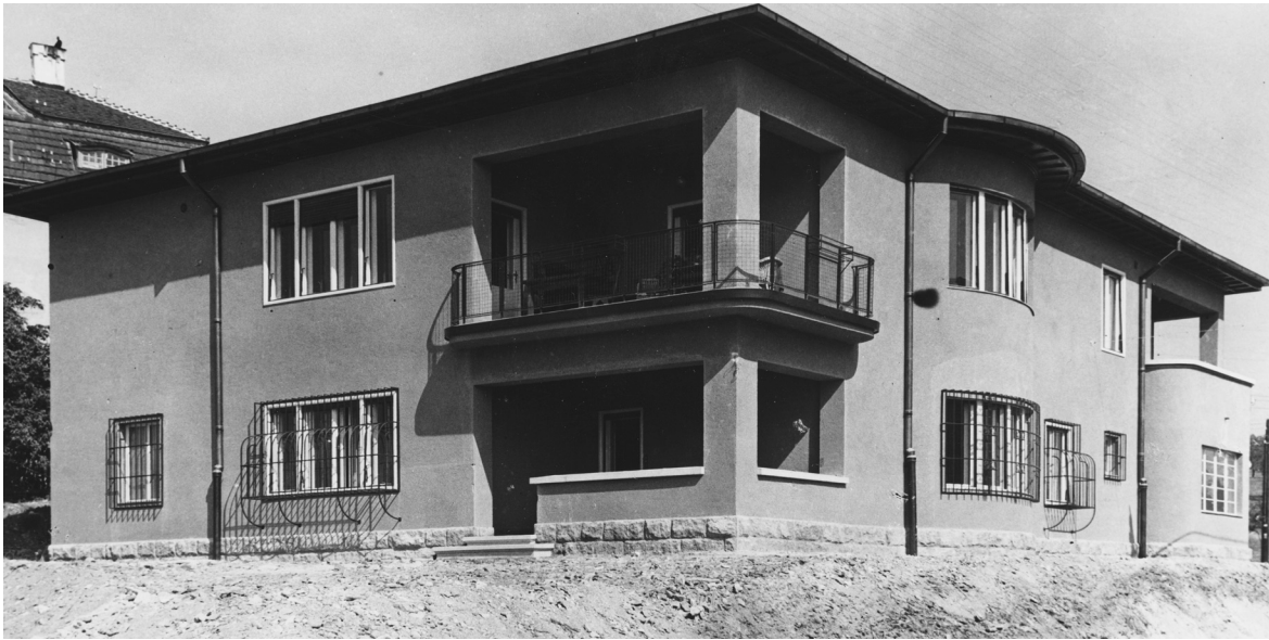
Az Eszter utcai családi ház

A Margit-híd pesti hídfőjétől északra korábban lakatlan, homokos vidék húzódtott, raktárakkal, néhány gyárépülettel. Ennek beépítése merész ötletnek tűnt. Az építkezést a budapestiek és az építész szakma tagjai is nagy érdeklődéssel figyelték. A legnagyobb nehézség az volt, hogy a vízparti telkek talaja kevésbé volt teherbíró. Ezt vasbeton alapozással ellensúlyozták és többszörös vízszigeteléssel. Az elkészült házakban nagypolgári lakások kaptak helyet, beépített porszívókkal, gázmelegítő fűtőszobakályhával. Korukban nemcsak kifejezetten modernnek számítottak, hanem lakóiknak kivételesen kényelmes életkörülményeket is biztosítottak.