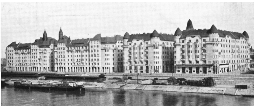
A Palatinus-házak korabeli képe

Ez a fajta gyűlölködés különösen a múlt század húszas éveiben erősödött fel. A Horthy-korszak a konzervatív építészeti stílusokat preferálta, a progressziót pedig üldözte. Ezt összefüggésbe hozták a művészek zsidó voltával, akiket ilyen alapon próbáltak kiseprűzni a magyar kultúrából. Voltak olyanok, akik egyenesen Lajta Béla műveinek megsemmisítését követelték.