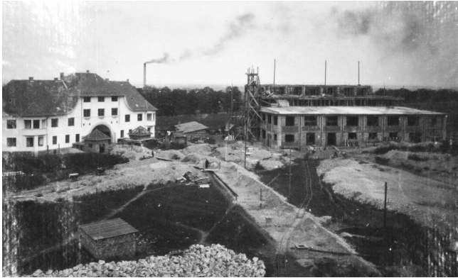
A Polgári Serfőző csomagolójának építése

te. A sörgyártásra utaló fríz által látványossá tett ház művelődéstörténeti jelentőségű. Harmadik emeleti elegáns lakásában lakott Kiss József költő, és itt kapott helyet A Hét szerkesztősége és kiadóhivatala is.