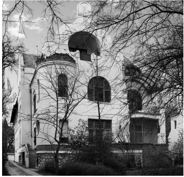
Az Egger-villa (Városligeti fasor 24.)