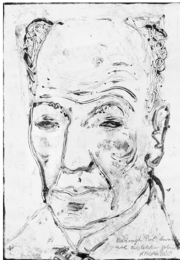
Kádár Béla: Önarckép