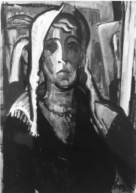
Gráber Margit: Önarckép

Noha egyszerű ceruzaképről van szó, amely nyilván borzalmas időkben és nagyon nehéz körülmények között készült, a még halálában is karizmatikus rabbi portréja többé vált egyszerű dokumentumnál – autonóm, megrázó műalkotás, amelyben összeér a zsidó sors általában és az individualista portréhagyomány.