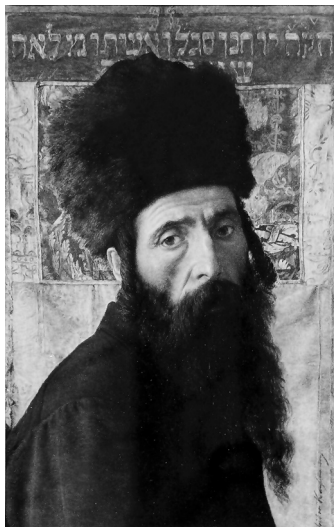
Kauffmann Izidor: A fanatikus

Aba-Novák Vilmosnál, Gedő Lipótnál, Scheiber-nél és Kádár Bélánál már modern, individualista önarcképről van szó – legalábbis képeiken és önarcképeiken ezek a progresszív alkotók semmilyen viszonyban nincsenek sem a zsidó, sem – Aba-Novák esetében – a másféle vallási-kulturális háttérükkel, gyökereikkel. Modern művészek – nem a közösség felé, hanem a műértő, műgyűjtő polgárság mint szellemi közeg, befogadó közeg felé fordulnak; műveik szekuláris jellege nemhogy egyértelmű, de egyenesen képi világuk fő jellemzője, legalábbis a karikatúristaként dolgozó Gedő és a karikatúraszerűségre mindig is hajló Scheiber esetében mindenképp.