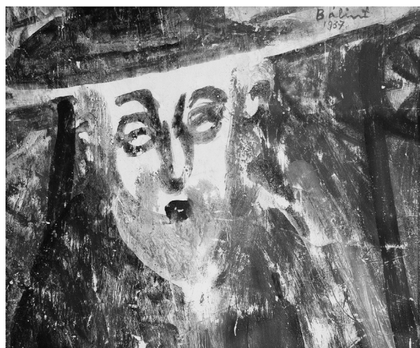
Bálint Endre: Öreg zsidó