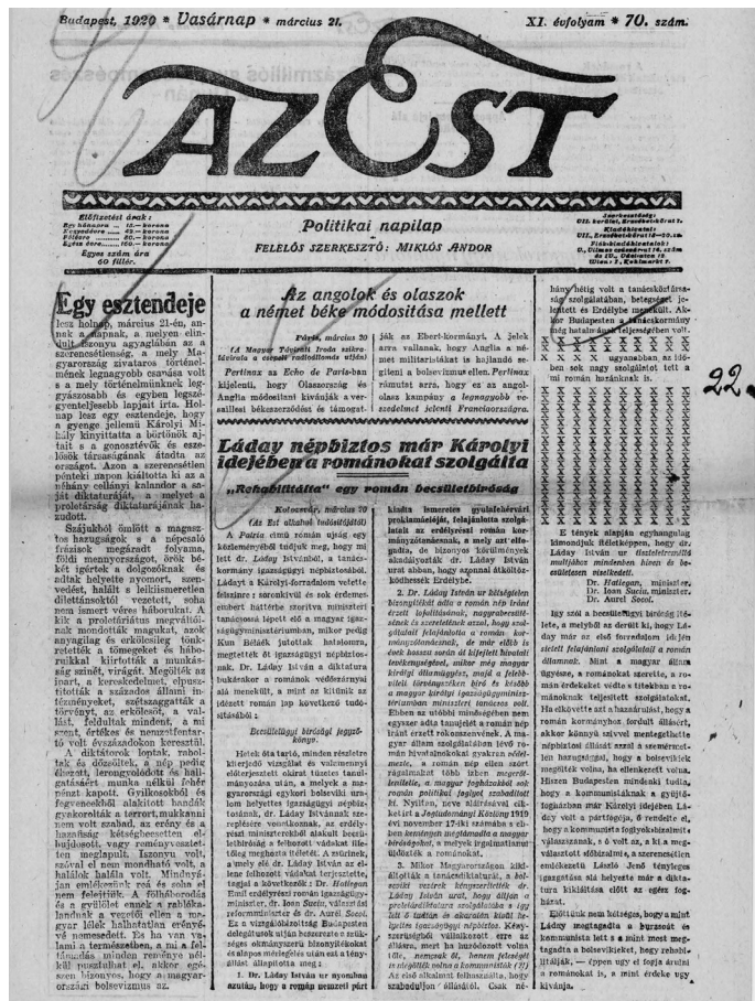
Az Est 1920. március 21-i címlapja

A lap még a Vörös Hadsereg harcairól is negatív torzképet festett, mivel úgymond „lelkiismeretlen diktánsok vezette, soha nem ismert véres háborúkat hoztak”, és a proletariátus megváltása helyett valójában „kiirtották a munkásság színét, virágát”. 128 Az „iszonyú” Tanácsköztársaság egyetlen pozitív következménye Az Est megemlékezése szerint az volt, hogy a feltámadás reménye nélkül pusztult a magyarországi bolsevizmus. Ez a megállapítás különös