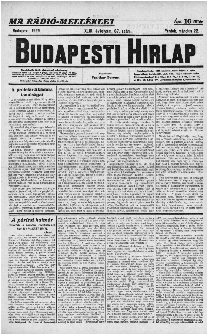
A Budapesti Hírlap 1929. március 22-i címlapja

„Az anarchia csupán aratása az anarchistáknak, az átkos vetés azonban bűne mindazoknak, akik a belpolitika tevénytőrdjébe akarva, nem akarva a baj méregmagvait hintik” 46 – írták az összeesküvés-elméletek