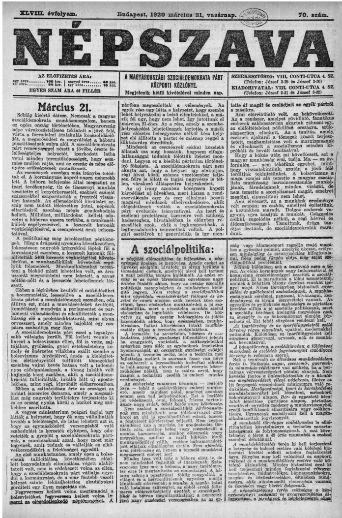
A Népszava címlapja 1920. március 21-én

Hasonlóképp tettek a Népszavában az 1929-es, tizedik évfordulón is: „Az elmúlt tíz esztendő legvakmerőbb bűvészi produkciója a világháború uszítóinak az a mesterkedése, amellyel a saját szörnyű bűneikért másokat akarnak felelősségre vonni. [...] Minden, ami a világháború után következett, a forradalom, a bolsevizmus és az ellenforradalom, azoknak a hitványoknak a vétke, akik a népek tudatlanságát fölhasználva, háborúra uszítottak.” 165 A Népszava évtizedes, nagy ívű megemlékezésének konklúziója szerint a „reakció erőszaka” volt „a bolsevizmus és a forradalmak megvetője”. Ezért intésként fogalmazták meg a szociáldemokraták, hogy a Bethlen-kormány „újabb katasztrófát fog zúdítani az országra”, ha nem hagy fel az erőszakkal. A „bolsevista demagógia” hatástalanítására ugyanis nem az erőszakot, hanem csakis az általános, egyenlő és titkos választójog bevezetését tartották megoldásnak a szociáldemokraták, amint azt