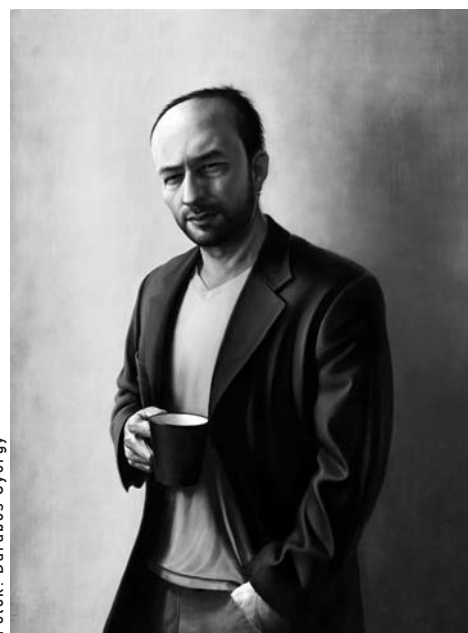
Kupcsik Adrián: Zsidó önarckép (2008. olaj. fa. magántulajdon)