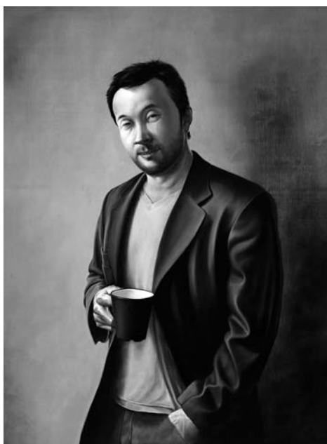
Kupcsik Adrián: Kínai önarckép (2008. olaj. fa. magántulajdon)