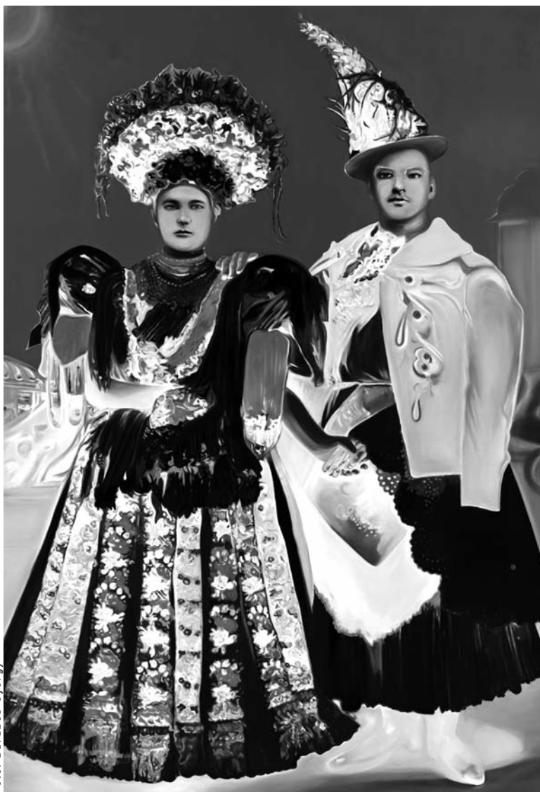
Csurka Eszter: Cím nélkül (2012. olaj, vászon, a művész tulajdona)