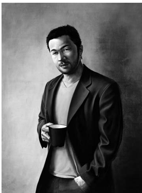
Kupcsik Adrián: Cigány önarckép (2008. olaj. fa. magántulajdon)