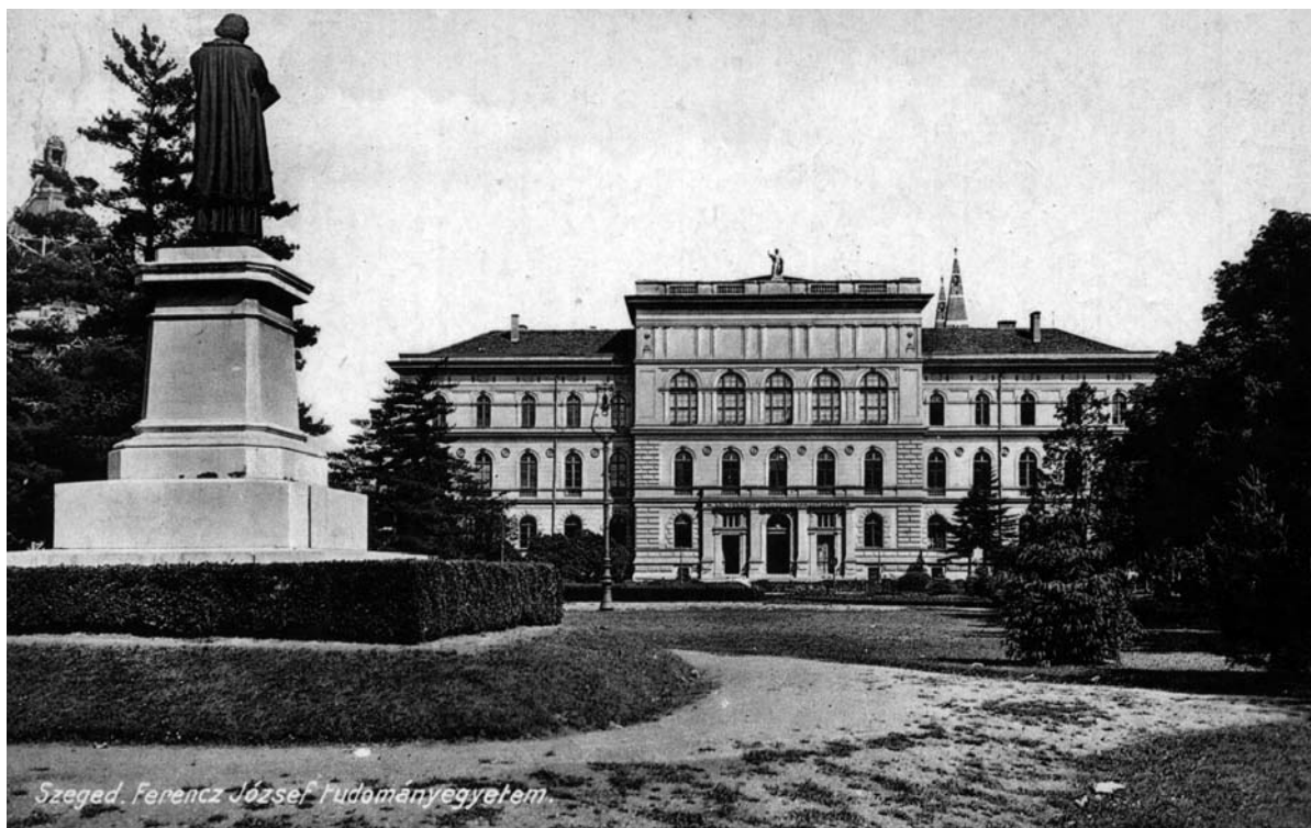
A szegedi egyetem központi épülete