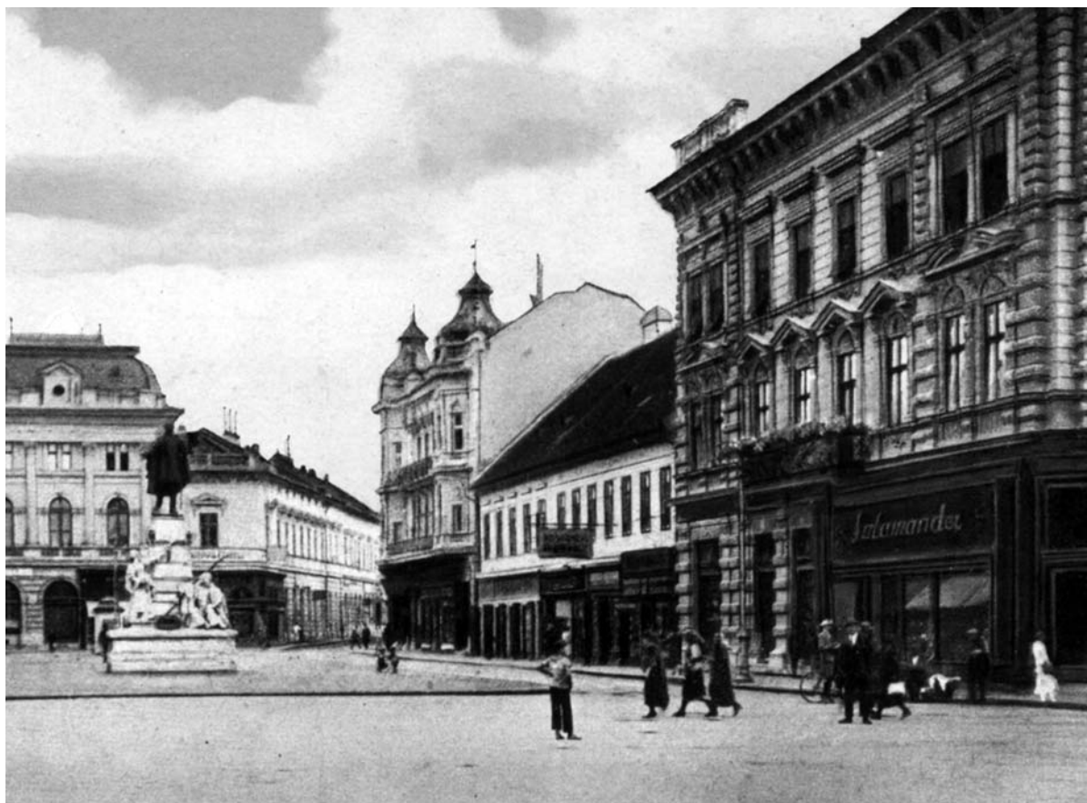
A jobboldali ház második emeletén működött a menza

nem kalapot viselve próbált volna följutni! (Ezen évek szegedi egyetemi antiszemita kilengéseiről ld. Ferencz [199–204], és Nyilas Péter: Zsidóverések a szegedi egyetemen , Szegedi Műhely, 2009. 2.).