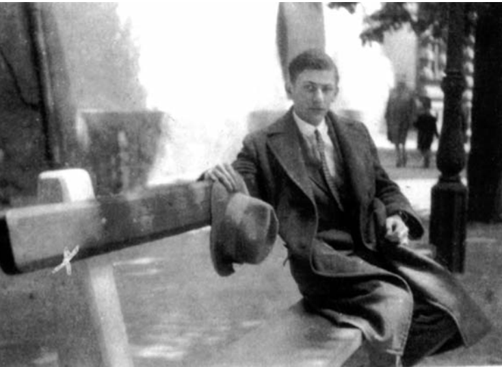
Radnóti Miklós 1927-ben