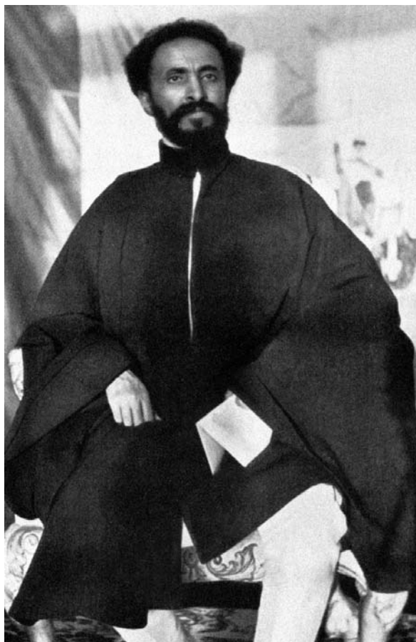
Haile Szelasszié, etióp császár

téniszprofesszor – mutatott rá, hogy a fasiszta Olaszország az afrikai kolonizáció során sem a francia gyarmatosítási politikát, 20 sem pedig az angol úgynevezett indirect rule 21 rendszert nem alkalmazta. Egy harmadik, radikális utat választott. A cél a szigorúan rasszista és szegregált adminisztráció felállításával egy új, etiópok nélküli Etiópia létrehozása volt. 22 1936 és 1937 nyara között egy sor olyan rendelkezést léptettek életbe – ezeket később az összes afrikai olasz gyarmatra kiterjesztettek –, amelyek arról rendelkeztek, hogy a köztereket, a kávéházakat, éttermeket és hoteleket, a fürdőket, valamint a mozikat milyen arányban használhatja az olasz, illetve az őslakosság. 23