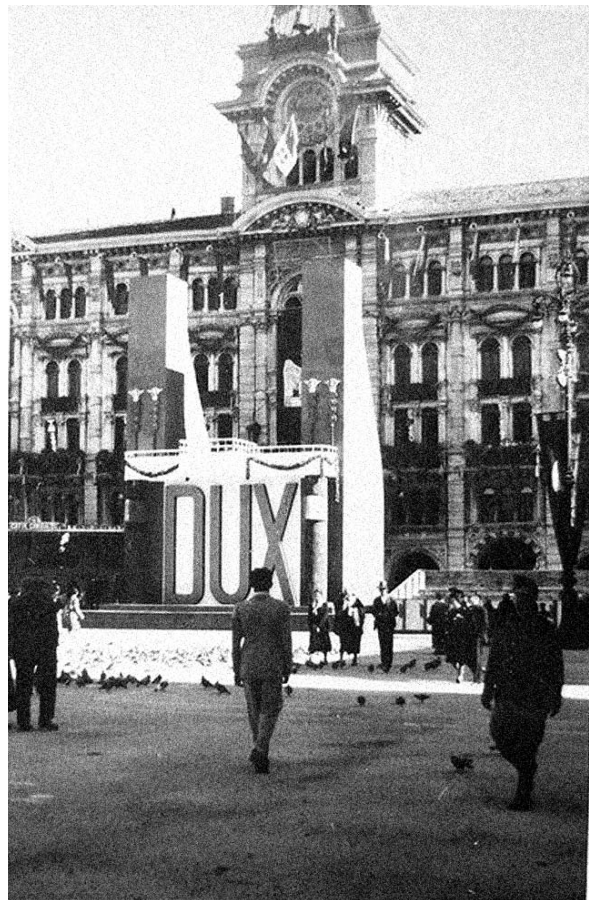
Trieszt a Ducét várja

Mussolininek súlyos gyomorfekélye volt, és többek között vérszegénységben is szenvedett. Hitler ezért is küldte a specialistát Mussolini mellé, és természetesen azért, hogy mindenre kiterjedő szoros ellenőrzést biztosítson felette. A német szakember kiegészítő tevékenységéről, a külön jelentésekről bizonyosan Mussolini is