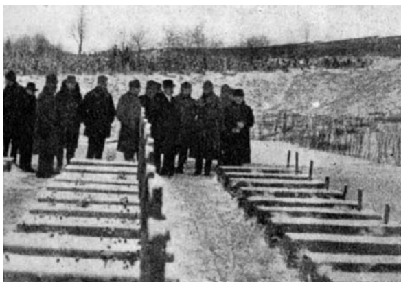
Az exhumáltak újból való eltemetése

nem táplál Törökországgal szemben, és teljesen meg van elégedve a központi hatalmak diplomáciája által felajánlott megoldással, mely a török államjogi kereteken belül Palesztínának szabad gyarmatosítását s a zsidó gyarmatok teljes kulturális és gazdasági önállóságát és fejlődési lehetőségét garantálja. Az entente ezzel szemben ugyan többet ígér: egy teljesen önálló zsidó állam megalkotását az ősök földjén. De világos, hogy Anglia könnyebben akadozhat a török birodalom területéből, mint a központi hatalmak. Másrészt senki sem ringatja magát hamis illúziókban a kapitalista államok altruista törekvései felől, és mindenki tisztában van azal, hogy Angliának legkisebb gondja is nagyobb annál, hogy a zsidóság évezredes álmát valóra váltsa. Ám a helyzet úgy fordult, hogy Anglia számára kívánatos egy önálló zsidó Palesztína megalakulása, s e tekintetben az angol külpolitika párhuzamosan halad a cionista törekvésekkel. Csakis e kedvező konstelláció alapján remélheti a cionizmus céljainak esetleges megvalósítását. A kérdés ezek után az, hogy ilyen körülmények között micsoda álláspontot foglaljon el a cionizmus, és micsoda szerepet kell majd játszania a béketárgyalások alkalmával?