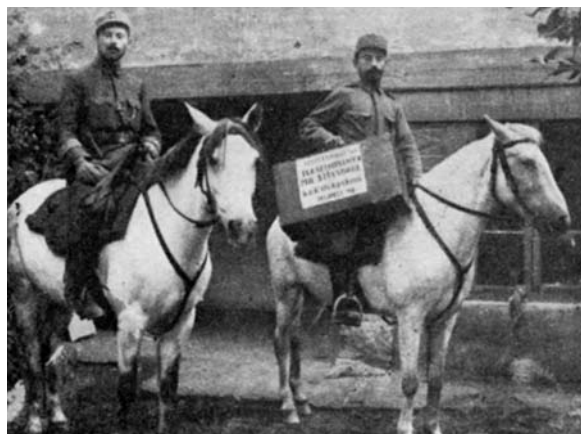
A zsidó „Feldkapelle” Albániában