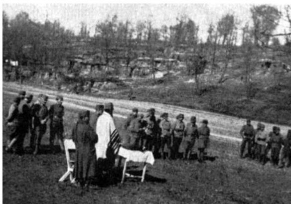
Istentisztelet a fronton