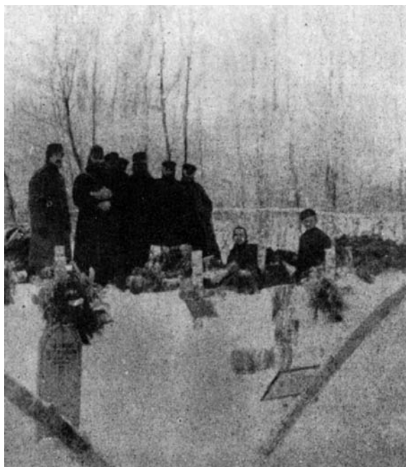
Exhumálás a front mögött

A cionizmus e jelentékeny eredményeivel és térfoglalásával számolt a török kormány, mikor