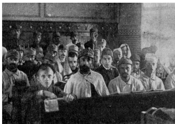
Zsidó istentisztelet egy katonai kórházban