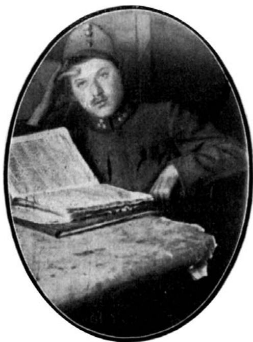
Perl szakaszvezető talmudot tanul a lövészárokban

Angliának jutott. Mint ahogy a központi hatalmak nem szándékoztak Oroszországnak visszaadni megszállt tartományait, úgy Anglia is bizonyára nehezen engedné ki kezéből az immár meghódított Palesztínát. De mint ahogy a központi hatalmak sem gondolhattak a lengyel tartományok végleges annektálására, úgy Angliának is le kell mondania Palesztína megtartásáról. S mint ahogy a központi hatalmak életre keltették a lengyel kérdést, és újra felállították a lengyel királyságot, hogy ezzel mindkét fél számára elfogadható semleges megoldást teremtsenek, úgy Anglia az önálló zsidó állam felállításával igyekszik hasonló semleges megoldást találni.