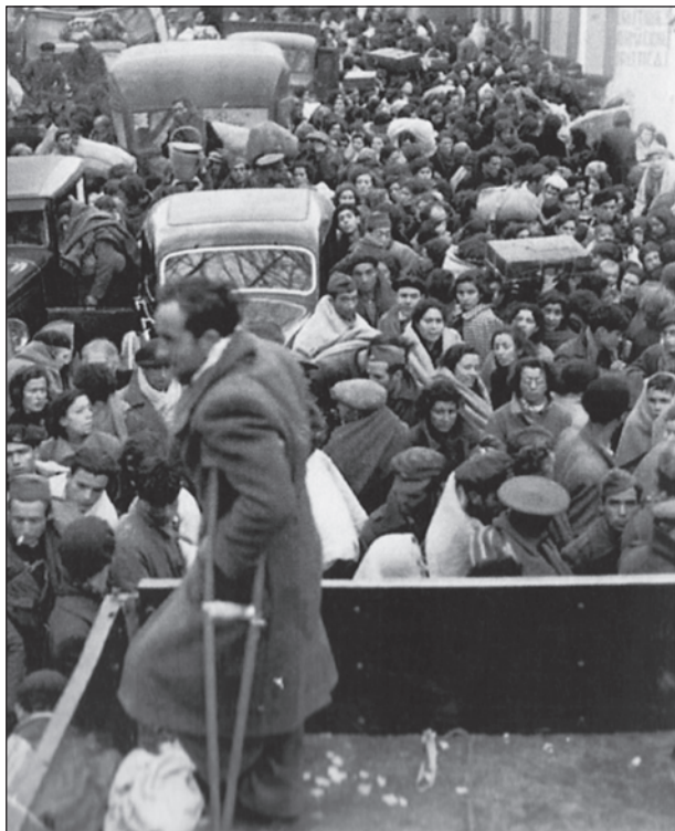
Spanyol menekültek átlélik a francia határt Perthusnál

náci zsidótlanítási program egy folyamat állomása volt, amelyet később újabbak is követtek. A népirtásban ugyanakkor nem coupán németek vettek részt . Felmerül a kérdés: Európa meghódítása esetén hol kezdődött a rezignáció, a beletörődés és hol az együttműködés? Hollandiában, Franciaországban a Vichy-kormány uralma alatt, Lengyelországban Jedwabne zsidó közösség lakosainak kiirtásában a helyi nem zsidó polgárok aktívan közreműködtek. Ez a magatartás morális katasztrófát jelentett. A hírhedt Gestapo, a Német Nemzetiszocialista Munkáspárt és az államgépezet sem volt mindenható. A társadalom és az emberek együttműködése, passzivitása és félelme nélkül lehetetlen lett volna a népirtást végrehajtani. Németországban sajátos együttműködés alakult ki a rendőrség, az állampolgárok és a politika között. A rendszer számíthatott milliók passzív hűségére, lojalitására. Napjaink emberének tehát történelmi értelemben választania kell a feledés és az emlékezés között – hangsúlyozza Carmen González. Minden személy választhat, és a múltban is választhatott. Ez sok tekintetben egyéni döntés és helyzet függvénye volt. A világosan látás tekintetében problémát jelentett az élet minden területét elárasztó agresszív náci propaganda antiszemitizmusa az oktatásban, az informális szférában, a szocializációs folyamatban.