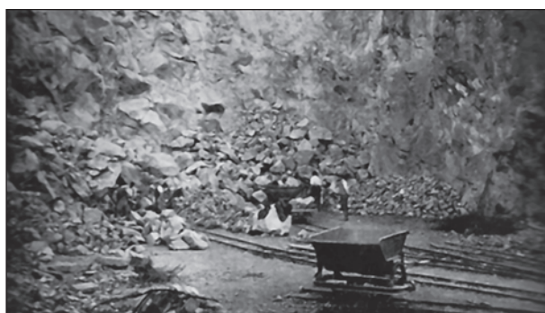
Spanyol foglyok építik a guseni koncentrációs tábort 1940-ben

A francia–spanyol határtól harminc kilométerre fekvő argelési táborban 180 000 menekült tartózkodott. Sokáig a szabad ég alatt voltak kénytelenek lakni. Argelés és St. Cyprien táborokban különböző adatok szerint rövid időn belül 15 000 és 50 000 közöttire volt tehető az elhunytak száma. A táborlakók között volt Ramon Gaya, a murciai festészet egyik legnagyobb alakja, aki egy Franciaországban élő festő barátja segítségével elhagyhatta deportálása színhelyét, és Mexikóba távozott. Felesége azonban Figueres közelében, menekülés közben, a nacionalista erők bombatámadása során életét vesztette.