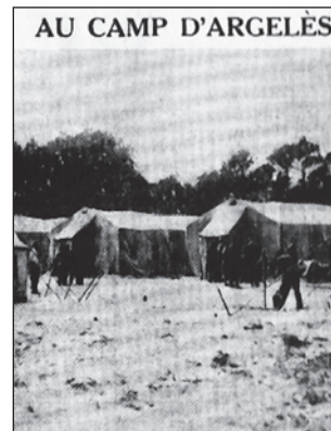
Az argelési befogadó tábor

A Mauthausentól öt kilométerre található Gusenben volt a spanyolok legnagyobb megsemmisítő tábora, amit 1939-ben kezdtek el építeni. 1941. január 24-én érkezett az első spanyol köztársasági