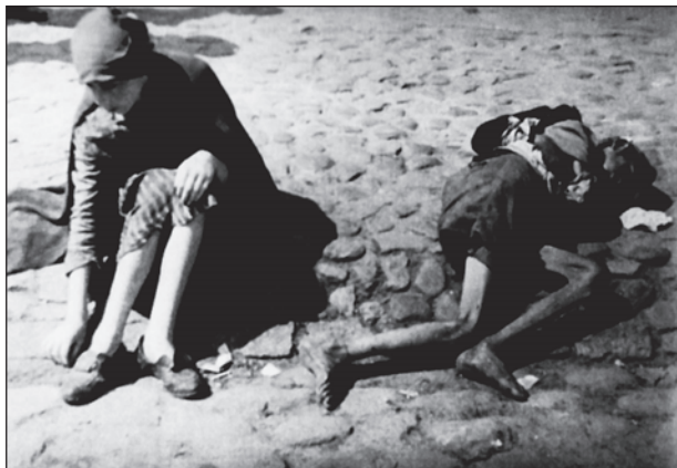
Hétköznapi jelenet egy gettóban. Szenvedés, fájdalom és halál

emberiség és a zsidóság történetében. Annak ellenére, hogy a fejezetben nem tesz különbséget a két fogalom tartalma között, tisztában van azzal, hogy a zsidóság számára ez két különböző dolgot jelent. Haim Vidal Sephiba aushwitzi túlélőt idézve hangsúlyozza, hogy a holokauszt bibliai kifejezés, amely a héber olab , jelentése teljes feláldozás, teljes áldozat fordítása. De: Auschwitz semmilyen szempontból sem tekinthető a zsidó nép oltáron, oltár előtt tett áldozatának. Az genocídium volt. A hatmillió elpusztított ember népirtás elszennedője, és nem oltár előtt tett áldozat alanya és részese volt. A genocídium ugyanakkor egy olyan szó, egy olyan kifejezés, ami a népirtás valamennyi formájára általánosan vonatkozatható és használható. Létezik azonban a genocídiumnak egy sajátos esete, ez pedig a zsidók megsemmisítése. Erre érvényesnek tekinthető és alkalmazható a soá kifejezés, amely héberül a teljes megsemmisítést jelenti, és ez nem bibliai jellegű kategória. Nem kell megszentés, szakralizált formát adni annak, ami népirtás, gyilkosság volt – olvashatjuk Carmen González könyvének 16., valamint Santa Puche: Libro de los Testimonios: los sefardíes y el Holocausto (Sephardi Federation of Palm Beach County, Barcelona, 2003.) kötetének 109. oldalán.