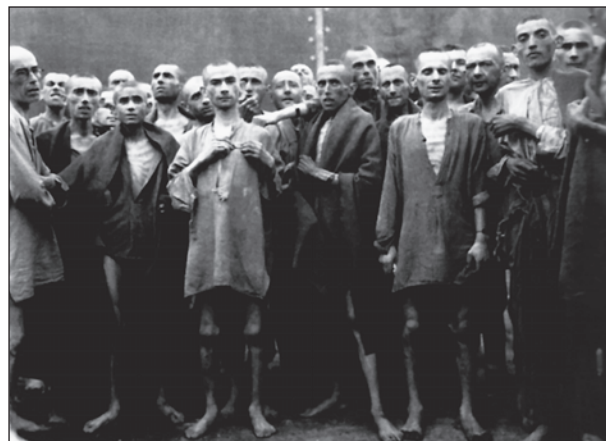
Felszabadult foglyok Mauthausenben

(Carmen González Martínez – Fuensanta Escudero Andújar – José Andújar Mateos: El naufragio de la humanidad. Republicanos españoles y murcianos en los campos de concentración . Editorial Enkuadres, S. L., Valencia, 2014.)