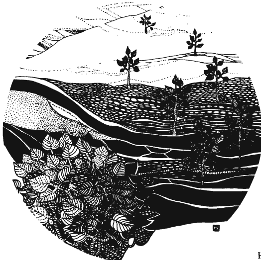
HÁRS BEÁTA RAJZA