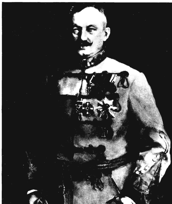
BÁRÓ HAZAI SAMU- HONVÉDELMI MINISZTER 1910-TŐL 1917-IG. ENGLERTHEMIL FESTMÉNYE (1913)

A zsidók összlétszáma a megszállt területeken 460 000-re rúgott. A magyar részről szorgalmazott népszavazás eredménye tehát a stratégiaileg fontos területeken döntő mértékben a zsidó lakosság magatartásától függött volna. Hogy mindezt