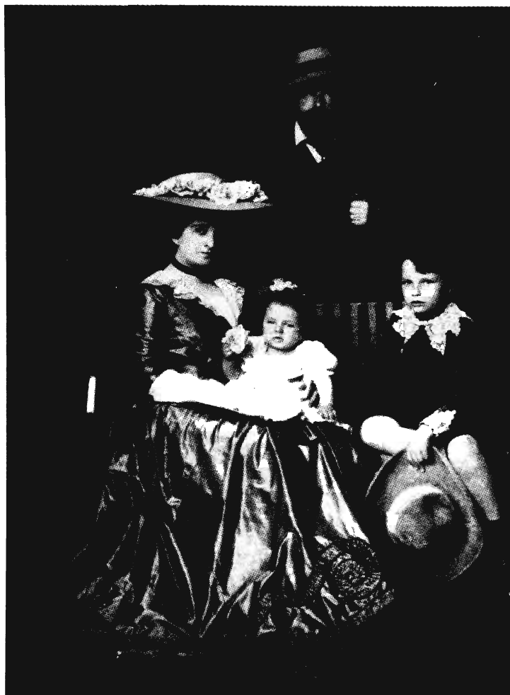
ARTHUR SCHNITZLER (CSALÁDJÁVAL)

genedés következménye – párhuzamot mutat jelenlegi helyzetünkkel.