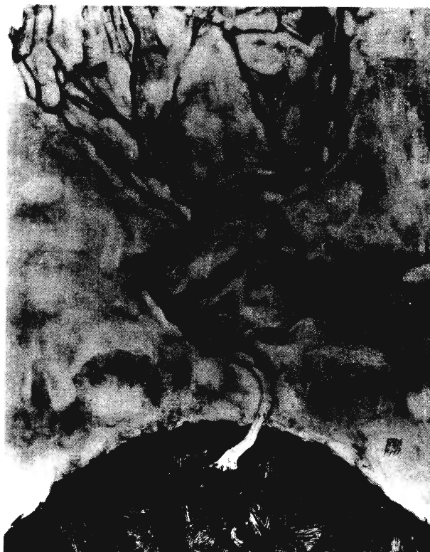
EGGON SCHIELE MŰVE

és mellette egy olyan – elfogadható – társadalom, melynek legfőbb értéke volt a törvényekkel önként korlátozott egyéniség szabadsága, az emberi egyenlőség: a MENSCHHEIT eszméje, és a nevelődés, azaz a BILDUNG fogalma. Mindez érthetőbbé teszi, hogy a zsidóság számára miért jelentette a „németiség” a legjobbat, még azokban az időkben is, amikor az a többi nép számára már egészen mást reprezentált. Ez a gondolati rögzültség az oka, hogy zsidókból oly radikális német nacionalisták válhattak, akik képesek voltak szövetséget kötni Georg von Schoenererrel. A zsidók számára Németország valami egészen mást jelentett, mint nem zsidó kortársaiknak.