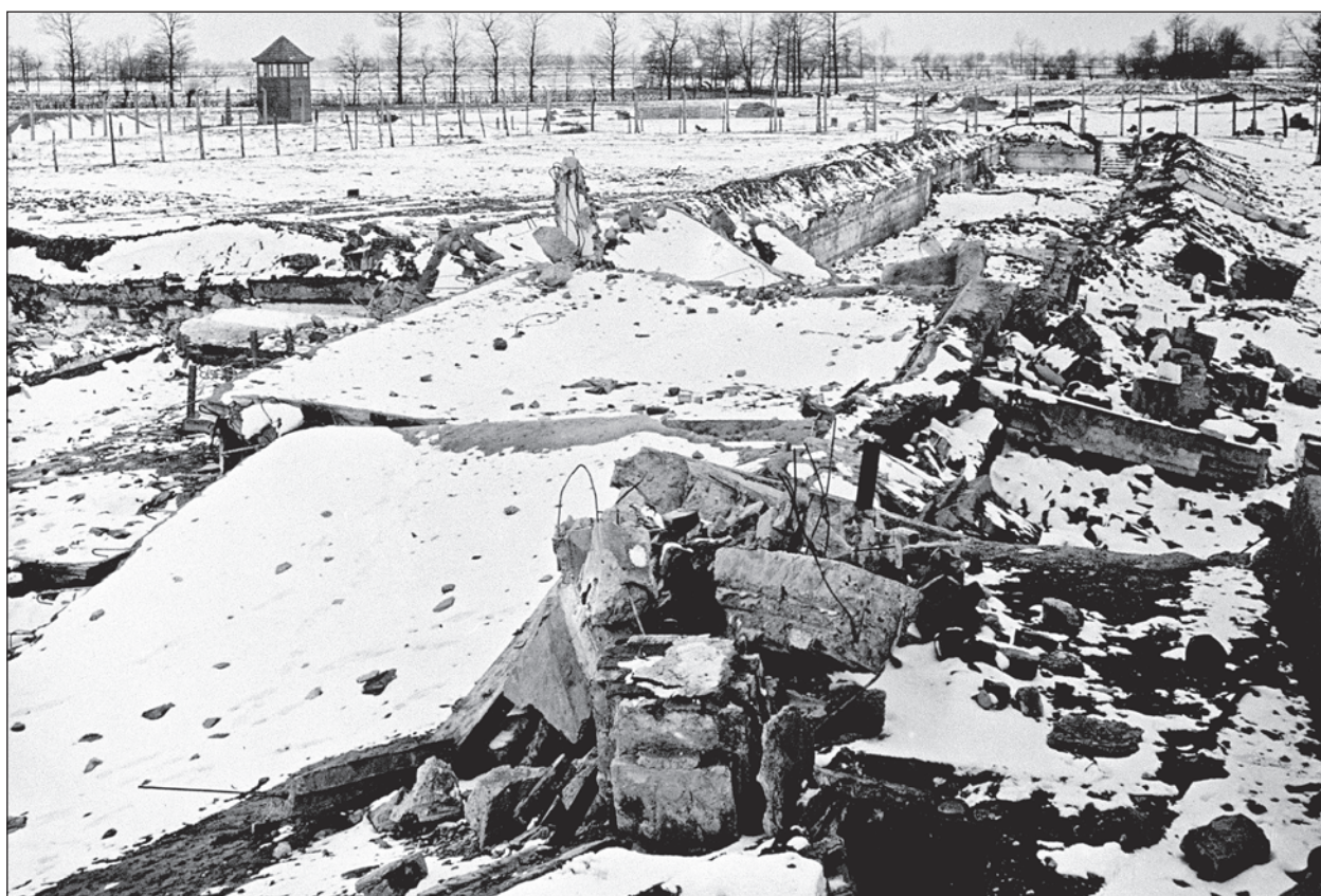
A II. krematórium romjai, 1945. február.