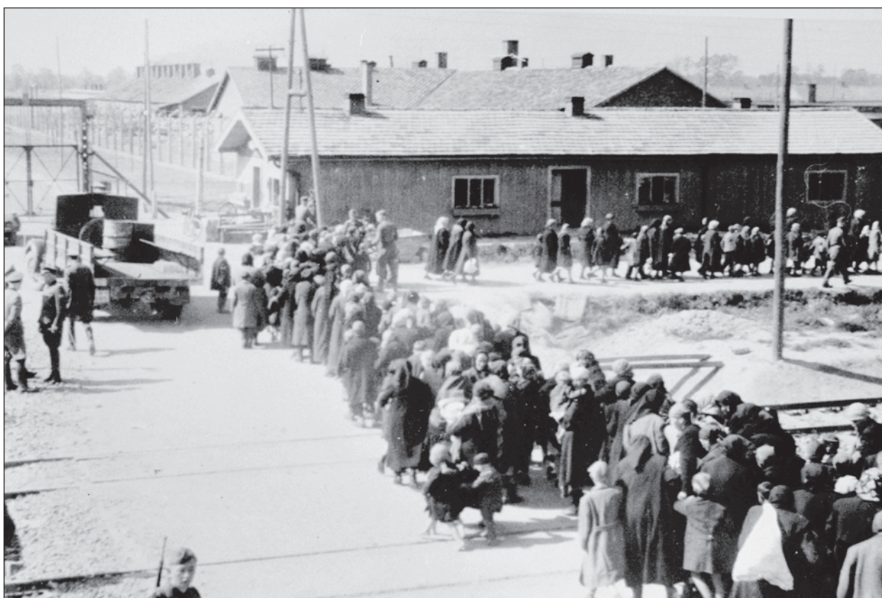
Zsidó nők és gyerekek a szelektálás után menetelnek a gázkamrák irányába. 1944. május