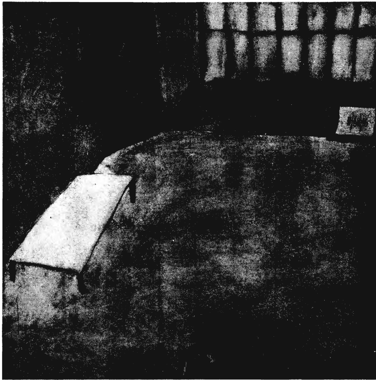
VÁLI DEZSÓ FESTMÉNYE: EGYSZERŰ MŰTEREM, 1988

zott, Hirsch rabbi és követői megtagadták az egyetemes zsidó egységet. Öt évvel a magyar szétválás után Hirsch rabbi is megkapta a porosz parlamenttől az engedélyt, hogy hívei kiváljanak a frankfurti anya-hitközségből. Ez 1876-ban történt. Ezután három évvel indult el Adolf Stöcker antiszemita mozgalma Berlinben, amely megkülönböztetés nélkül minden zsidót megfosztott volna a politikai és társadalmi jogaitól. A mozgalomhoz csatlakoztak Stöcker magyar kortársai is, Istóczy Győző fellépésével. 1882-ben részük volt a tisztaeszlári vérvád körüli országos felbolydulásban és a rá következő kilengésekben. A magyar zsidóságnak is bőven volt alkalma és nyomós oka arra, hogy kiábránduljon az illúzióiból. Lehetséges, hogy az ezekben az években felébredő zsidó szolidaritás meggátolhatta volna a vallási szétválást, de a szakadás akkor már megmászhatatlan tény volt. Csak a mi nemzedékünk ébredt rá arra, a zsidóüldözés végletes kiteljesedése során, hogy a zsidóság minden különbözőségei ellenére egy sorsot él.