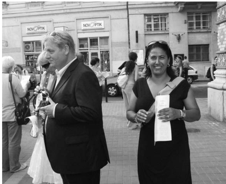
Tarlós István (2007-ben) a Sófár Egyesület rendezvényén, ahol a Zsidó negyed zsidó jellegének megmaradásáért tüntettek. Reméljük, hogy új tisztében ugyanezekért az elvekért sikeresen, sőt: elődjénél nagyobb sikerrel tud tenni, cselekedni

Az erkély alatt fekete kabátos, fehér inges fiúk lépkednek a Vasvári utcai jesiva felé, bársonyos talicskával kezükben, sietős léptekkel. Az idő sürgyet, sok az imádkoznivaló. Tikkun olám – a világ tényleg javításra szorul.