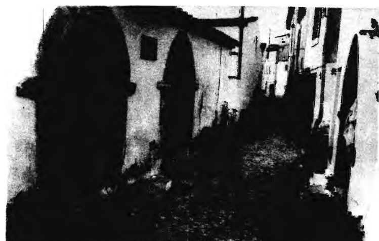
A PORTUGÁLIAI CASTELO DE VIDE, AZ EGYKORI ZSINAGÓGA BEJÁRATA

tekintetben (etnikai, nyelvi s részben még politikai tekintetben is) idegenként élt abban az országban, csak nemrégiben bevándorolt szülők gyermekeként, akiknek spanyol, illetve portugál eredetű családja épp Németalföld két ősellenségéhez kapcsolódott. Ha a vallást nézzük, családja kezdetben zsidó volt, aztán több generáción át hivatalosan katolikus (marannus), majd újra zsidó. E vallási kettősség egyik pólusát sem lehetett egykönnyen összeegyeztetni a fiatal Németalföldi Köztársaság uralkodó kálvinista kultúrájával.