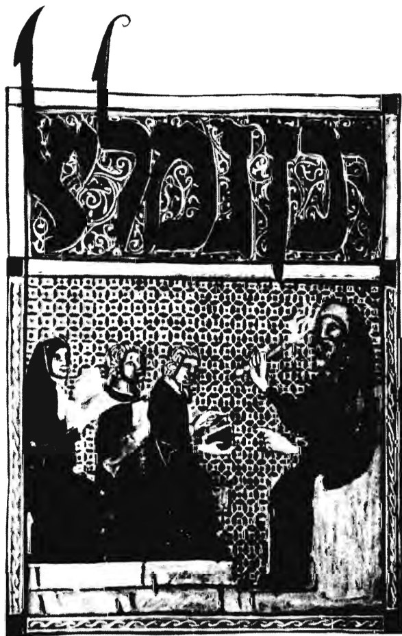
ILLUSZTRÁCIÓ A SZARAJEVŐI HAGGÁDÁBÓL (14. SZÁZAD ELEJE)

A tény, hogy a világ zsidónak tekintette, magányosságának egyik jele volt. Nem volt hajlandó azonosulni korra egyetlen kulturális vagy vallási csoportjával sem. Intellektuálisan a saját útját járta, maga volt az individuum par excellence, aki elvárja, hogy pusztán a saját privát lényé és hitelvei alapján határozódjék meg, ne pedig valamely társadalmi vagy történelmi vonatkoztatási rendszer lássa el az identitáshoz szükséges alkotórészekkel. Az egyetlen kötődés, amelyet Spinoza – legálabbis teoretikusan – elfogadott, politikai jellegű volt. Önmagát a Németalföldi Köztársaság polgárának tekintette, amelyet még „hazájának” is nevezett. Mégis, sok