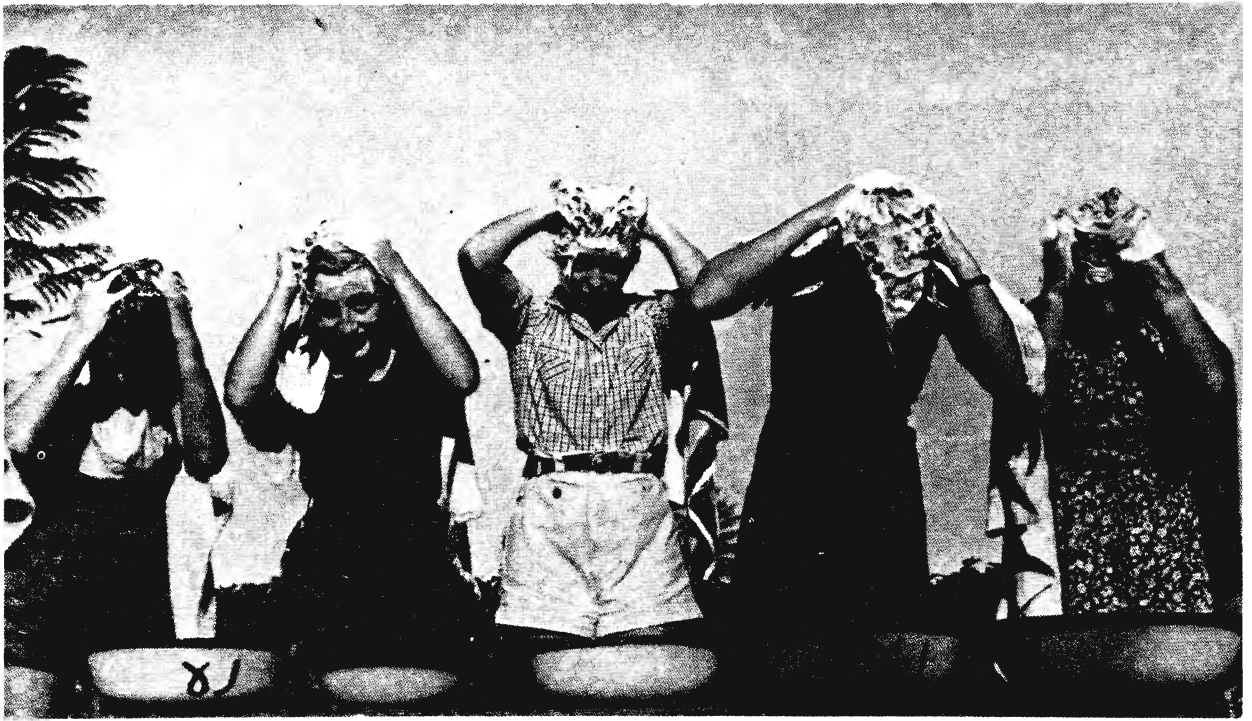
A DEGANAI ALEF KIBUCBAN, 1937