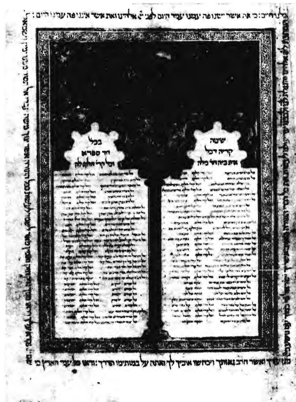
SÉM TOV-BIBLIA, MASZÓRA-HITELESÍTÉSSEL. ÉSZAK-Spanyolország, 1312. BERMUDA, FLOERSHEIM TRUST

Most értette meg, miért tartotta őt otthon az anyja nagypénteken és hűsvétkor, s miért cukkolták néha, még a barátai is,