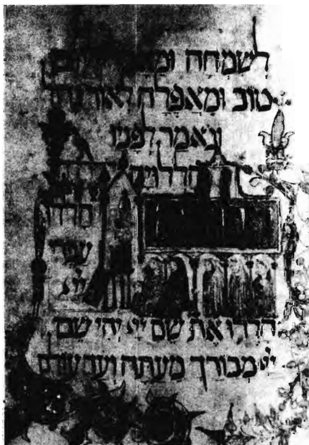
FELOLVASÓ ÉS GYŰLEKEZET A HALLEL-IMÁT MONDJA. A KAUFMANN-HAGGADA ILLUSZTRÁCIÓJA, 14. SZÁZAD. MTA, BUDAPEST

A spanyol politikai légkör, bár messze nem kedvező, mégis készen áll arra, hogy nyisson, sőt párbeszédet kezdjen a zsidókkal. 1945–50-ben az Izrael Állammal való sikertelen közeledési kísérlet után, a spanyolországi zsidók jogot kapnak a szabad vallásgyakorlásra, majd 1967-ben elismerik a kisebbségi vallások szabadságát. Franco egymás után magához hívatja a katalán, illetve