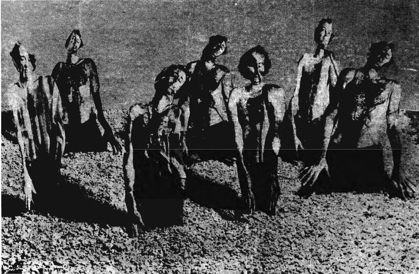
GYŰRT FIGURÁK 1983