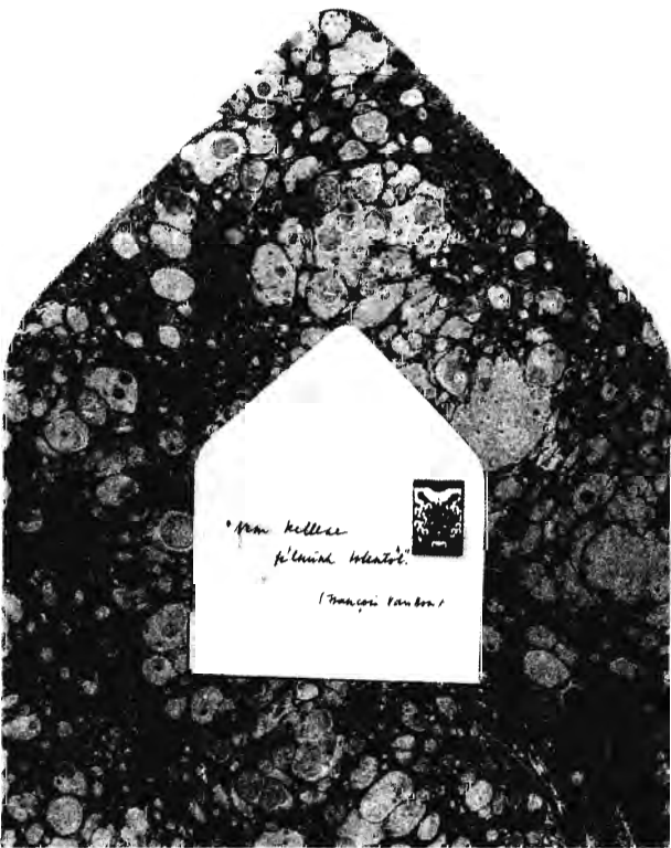
SZENES ZSUZSA: KIS PASZIÁNSZ