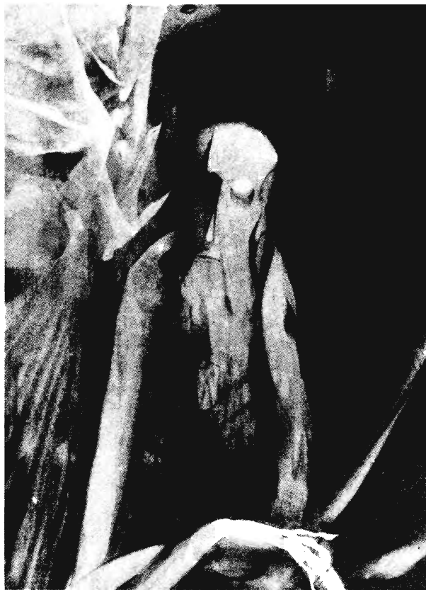
AZ ÖREG KIRÁLY

– A mi esetünkben ez kissé bonyolult képlet. A te képeidet Jeruzsálem királya, papjai és prófétái népesítik be, s az ódon várfalak között mai kaftános hívők igyekeznek az óváros újjáalakított zsinagógáiba. A műtermed néhány lépésre van az államelnöki palotától és Montefiore szélmalomtól. 150 gyönyörű miniatúrát festettél a 150 zsoltárról. A lemezjátszódról azonban több évszázados magyar virágénekek dallama csendül, s a polcokon magyar költők kötetei sorakoznak. A kedvenc zeneszerződ Bartók, a kedvenc költőd Szilágyi Domokos. A külföldi galériák számára Ausztriától New Yorkig egzotikus közel-keleti festőművész vagy, az ismerőseid szemében váradi, az adóhivatal szerint