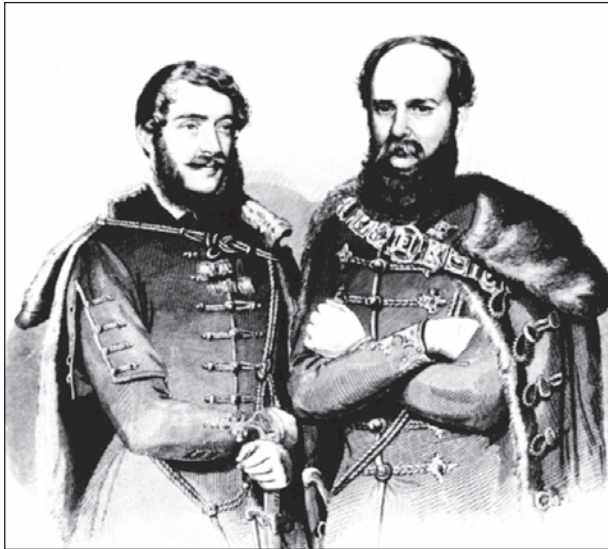
Tyroler József rézmetszete Batthyányról és Kossuthról

kéne reformálni. Persze nyilvánvaló volt, hogy a központi bizottmány előadója, Horvát Boldizsár a zsidó vallásra gondolt, de annak megnevezése elmaradt, talán éppen azért, hogy jótékony homály fedje a kényes kérdést: vajon a szöveg szerint is „kölcsonös idegenkedés” elhárítása végett miért csupán a zsidó vallást kéne átalakítani?