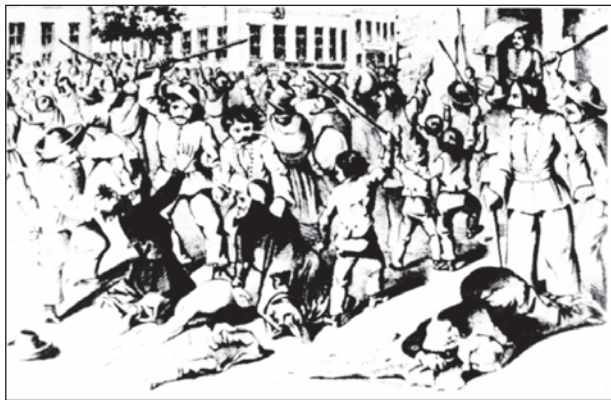
A pozsonyi pogrom 1848 tavaszán

én megjelent cikkéhez, a hasábnyi „vezérnézet”, ahogy maga Kossuth írta, döntő súllyal bírt a magyar zsidóság emancipációjának történetében – pontosabban annak reformkori elodázásában. Kossuth leszögezte: a „politikai”, vagyis jogi emancipáció ideje elérkezett. Csakhogy megítélése szerint a „társadalmi” emancipáció, vagyis a zsidók és keresztények egybeolvadása nélkül ez mit sem ér. E tekintetben pedig a kezdeményezés a zsidókat illette, hiszen a gondot vallásuk jelentette. A gond nem annyira állítólagos teokratikus karakterében rejlett, bár ha e teokratikus jelleg bizonyítást nyert, megfontolt reform révén feltétlenül ki kellett iktatni a zsidó vallásból. Kossuth legfőbb aggálya az volt, hogy a zsidó vallás dogmái és rituáléi által előírt „castai [értsd: kasztszerű] elzárkózás” megakadályozta a zsidók és a keresztény magyarok közötti „socialis egybeolvadást”. Egy hónappal későbbi, a megjegyzéseire reagáló Löw Lipót cikkéhez bigygyezett kommentárjában Kossuth tovább pontosított: amíg vallásuk miatt a zsidók „más vallású polgártársakkal egy söt, egy kenyeret nem ehetnek, egy bort nem ihatnak, egy asztalnál nem ülhetnek”, addig „socialiter emancipálva nem lesznek, ha mindjárt politicalag százszor emancipáltatnak is”. Kossuth azt javasolta: a zsidók tartsanak egy törvényhozó gyűlést, amelyen „alkalmas reformok által” töröljék vallásukból annak politikai, a keresztényekkel való társadalmi egybeforrásuknak útját álló elemeit. 9