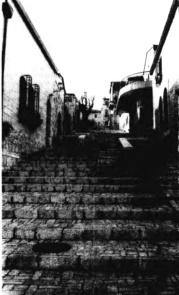
JEMIN MOSE.

- A Jemin Mose és a Miskenót Sa'ananim egykori megépítése között csaknem harminc év telt el: az utóbbi alapkövét 1855-ben rakták le, a Jemin Mose 1892-től épült. A rekonstrukciók 4 év különbséggel készültek el, 1972-ben, illetve 1976-ban. Azonosság továbbá, hogy mindkét épületegyüttes az angol Sir Moses Montefiore kezdeményezésének eredménye, és hogy 1967 után a Kelet-Jeruzsálemi Fejlesztő Társaság ránk bízta a rekonstrukciót. Montefiore szefárd zsidó családból származott, üzletemberként sikeres karriert futott be a múlt században, és mikor visszavonult az üzlettől, gazdagságát és figyelmét a zsidók megsegítésére fordította. 1827-ben járt először Jeruzsálemben, majd hatszor tért még vissza ide. 1855-ben kezdte el ennek az épületnek az építkezését, amelyet izraelita kórháznak szánt. Az épület fölé szélmalmost emeltetett, mindezt a jeruzsálemi zsidók segítségének céljából. A fémmunkákat Angliából hozatta, Ramsgate városából, ahol élt. A karcú oszlopokban ma is olvasható a védjegy: „G. S. Culver fémmunkája Ramsgate-ből”. Az építkezés teljes összegét, 6000 font sterlinget, amerikai zsidó filantrópok