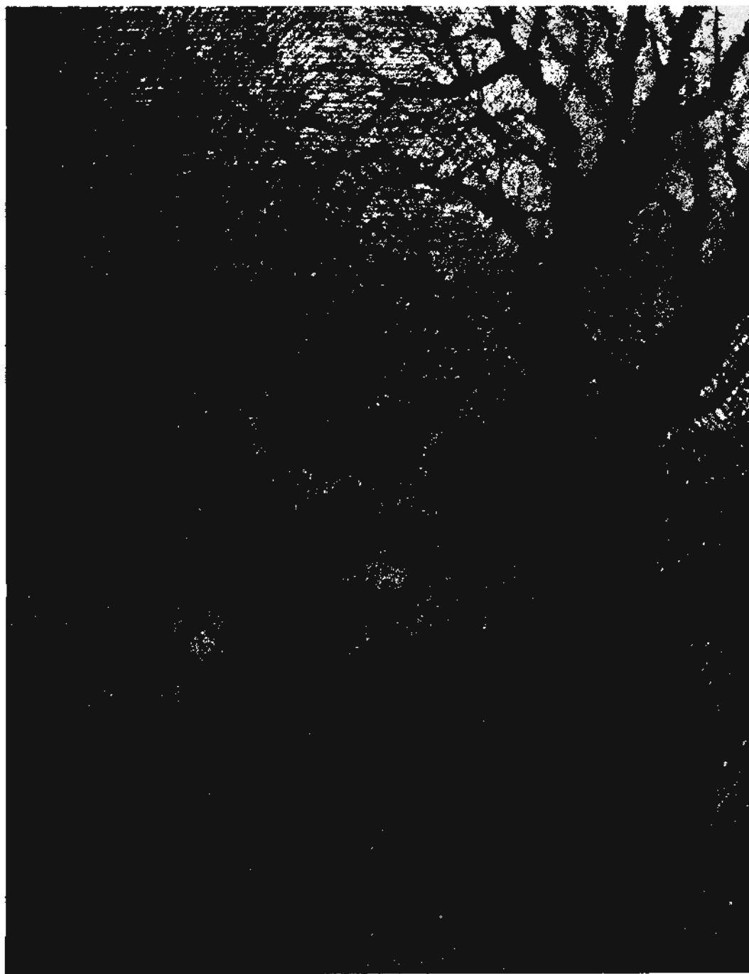
ABÁDI ERVIN GRAFIKÁJA