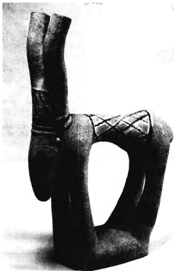
MOSHE SHEK. ÁLLAT