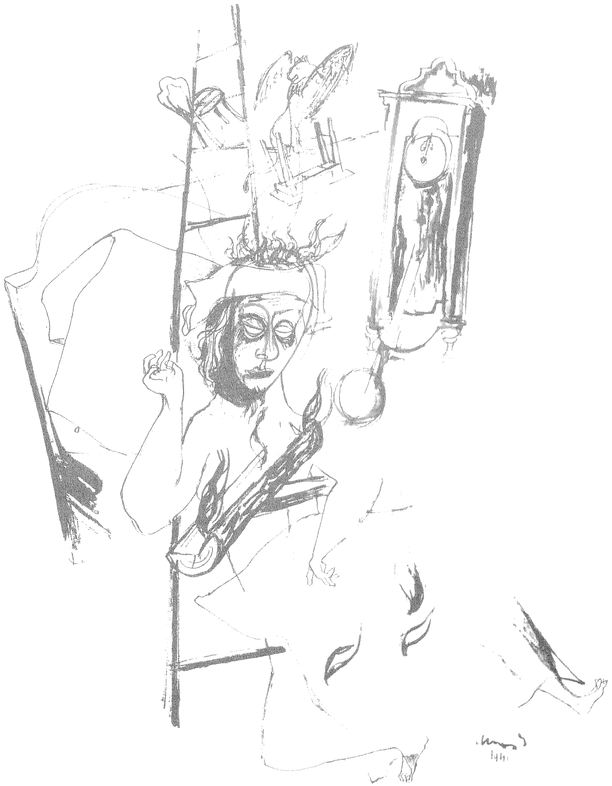
A szörnyű óra