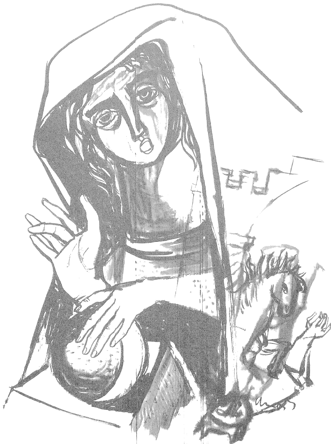
Kendős nő lóval