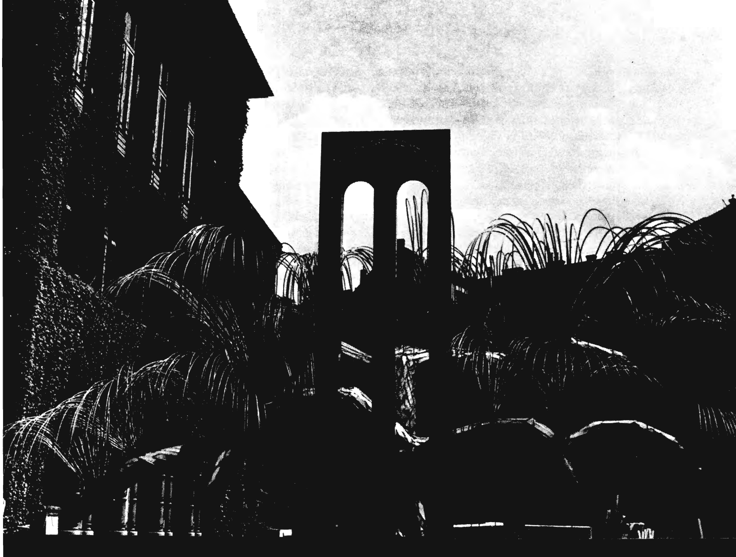
A MAGYAR ZSIDÓMÁRTÍROK EMLÉKMŰVE