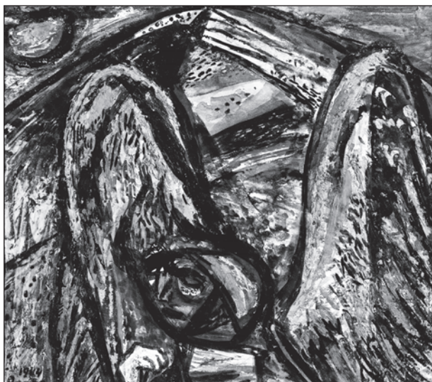
Ámos Imre: Angyal, 1944, gouache, papír, 18 x 22 cm, Ferenczy Múzeumi Centrum, ltsz. 69.37

rajzok és a Szolnoki vázlatkönyv a múzeumba. 9 Az utóbbi – Egri írásával – megjelent 1973-ban a Corvinánál. 10