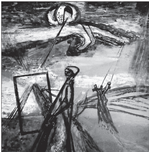
Ámos Imre: Látomás, 1944, tempera, papír. 280 x 280 mm, Ferenczy Múzeumi Centrum, ltsz. 84.497