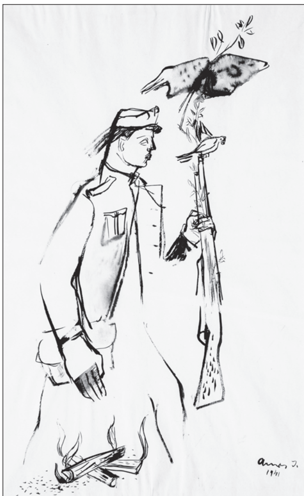
Ámos Imre: Katona galambbal, 1941, tus, papír, 575 x 420 mm, Ferenczy Múzeumi Centrum, ltsz. 84.415, fotó: Deim Balázs