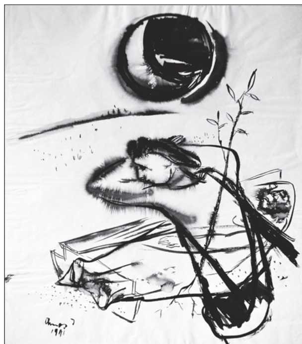
Ámos Imre: Emlékezés, 1941, lavírozott tus, papír, 350 x 300 mm, Ferenczy Múzeumi Centrum, ltsz. 69.35