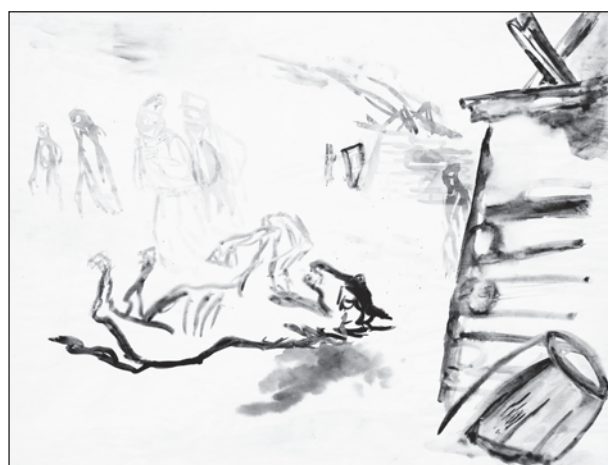
Ámos Imre: Lótetem, 1943, akvarell, diófa pác, papír, 457 x 488 mm, Ferenczy Múzeumi Centrum, ltsz. 84.456, fotó: Deim Balázs