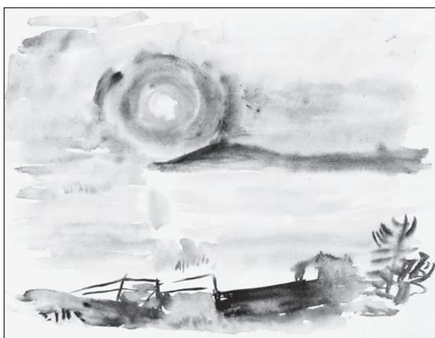
Ámos Imre: Naplemente, 1940, akvarell, papír, 231 x 292 cm, Ferenczy Múzeumi Centrum, ltsz. 84.373