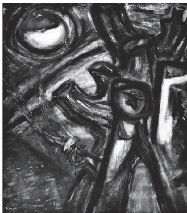
Ámos Imre: Sötét idők IV., 1944, olaj, vászon. 76 x 68 cm, Ferenczy Múzeumi Centrum, ltsz. 73.16