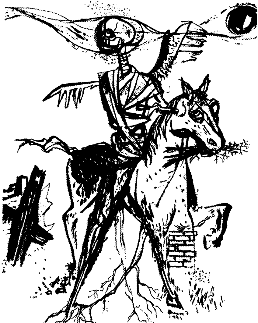
Amos Imrei: A tetű, 1943

A fundamentalizmus modern tünet, mely válasz a felvilágosodás folyamatára, a hagyományos társadalmi szerkezet felbomlására és lerombolására, a haladás eszményére, a racionalizmusban való hitre, a természetes közösségek, identitások, biztonság, bizonyosság eltűnésére, az előre nem látott eseményekre, a kiszámíthatatlanságra, az absztrakt szabadságfogalomra, melyet jóra vagy rosszra fordíthatunk. A fundamentalizmus zárt – szekuláris vagy vallási – eszmerendszer, amely ellenáll az összeegyeztethetőségről való párbeszédnek, mivel alapvetően összehasonlíthatatlannak tartja magát más hitrendszerekkel. A fundamentalizmus egy olyan világban kínál alapprincípiumokat, ahol azok – főleg kizárólagosan, egyedülként – nincsenek, és a hagyományos monoteista vallások igazságfogalmával él, amely mellett minden más ördögi, gonosz, eretnecség vagy pogányság. A valahová tartozás vágya, a kisebbséghez tartozás nehézségei, a