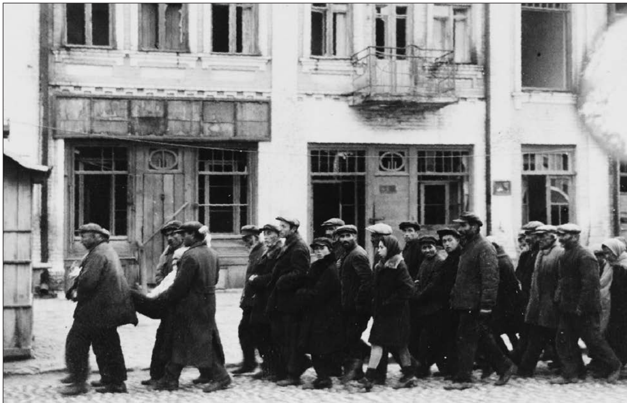
Magyar zsidók Kamenyec-Podolszkijban, útban a vesztőhelyre.