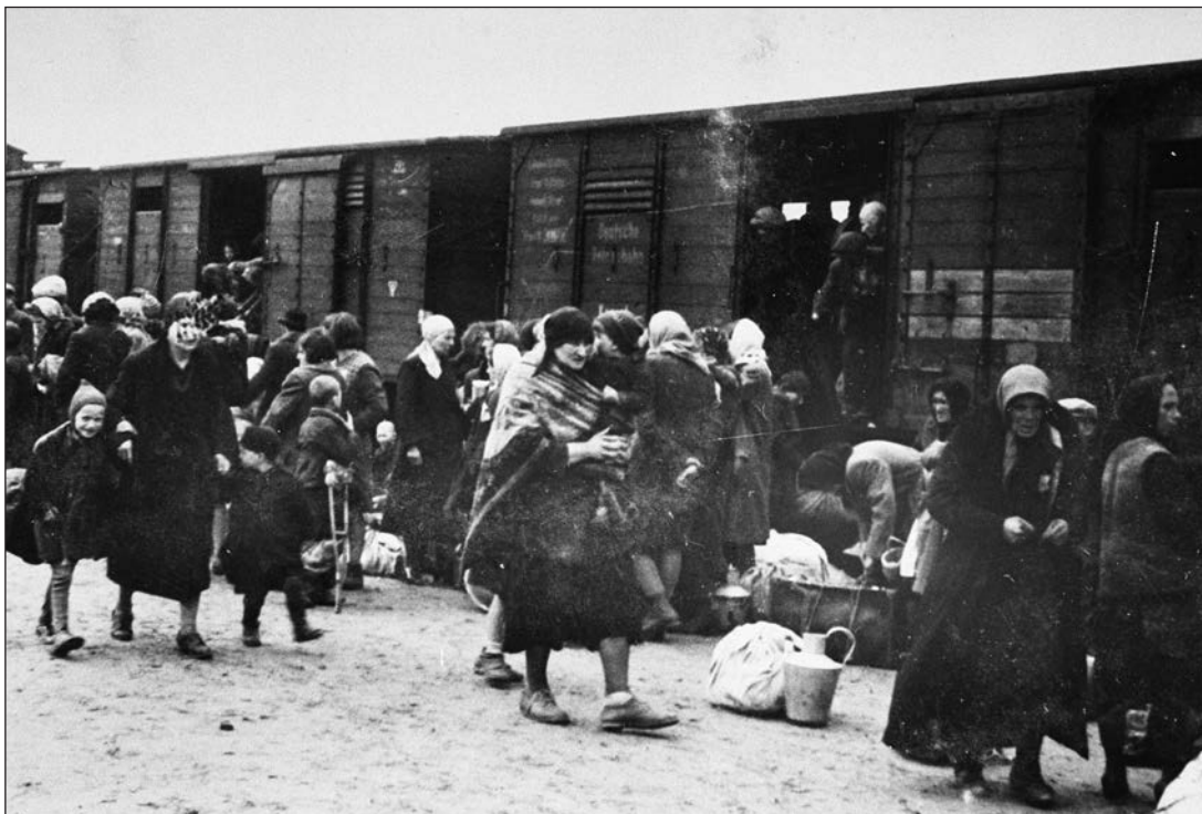
Kárpátaljai zsidók a birkenauai rámpán.