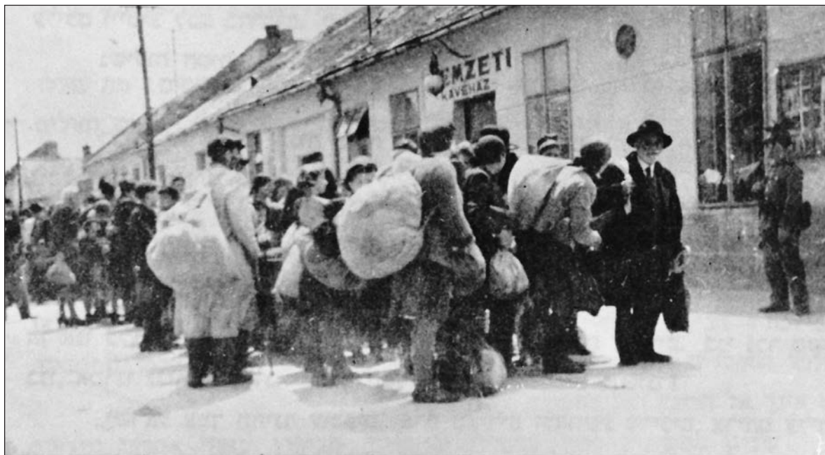
Deportálás Dunaszerdahelyről, 1944.