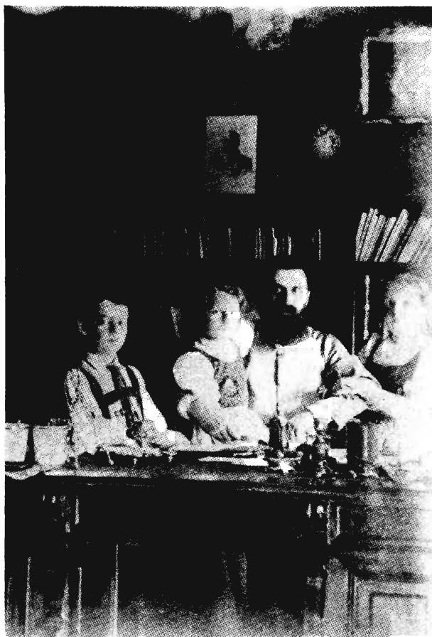
HERZL TIVADAR GYERMEKEIVEL BÉCSI DOLGOZÓSZOBÁJÁBAN

a járadék fizetését, s megszakította kapcsolatát a zsinagógával. Karl Marx apja inkább vállalta az áttérést, mint hogy elveszítse állását. E két híres 19. századi „új nem zsidó” esete példázza, mennyire csalóka a zsidó lét dilemmájából kivehető útként a keresztiséget választani: kortársai zsidónak tekintették Disraelit éppúgy, mint Marxot (még ma is így említik őket), továbbá mindkettejük írásaiból kiviláglik – habár igen különböző módon –, milyen nagymértékben foglalkoztatta őket zsidóságuk kérdése.