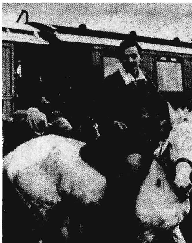
FIATAL NÉMET ZSIDÓK ÉRKEZÉSE PALESZTINÁBA, 1939.

Más országokban az állam általában hivatalosan nem tartja számon a zsidó állampolgárok identitását, még akkor sem, ha a vallásos intézmények bizonyos fokig beépülnek az államrendszerbe. Amerikában a vallást szigorúan elválasztják az