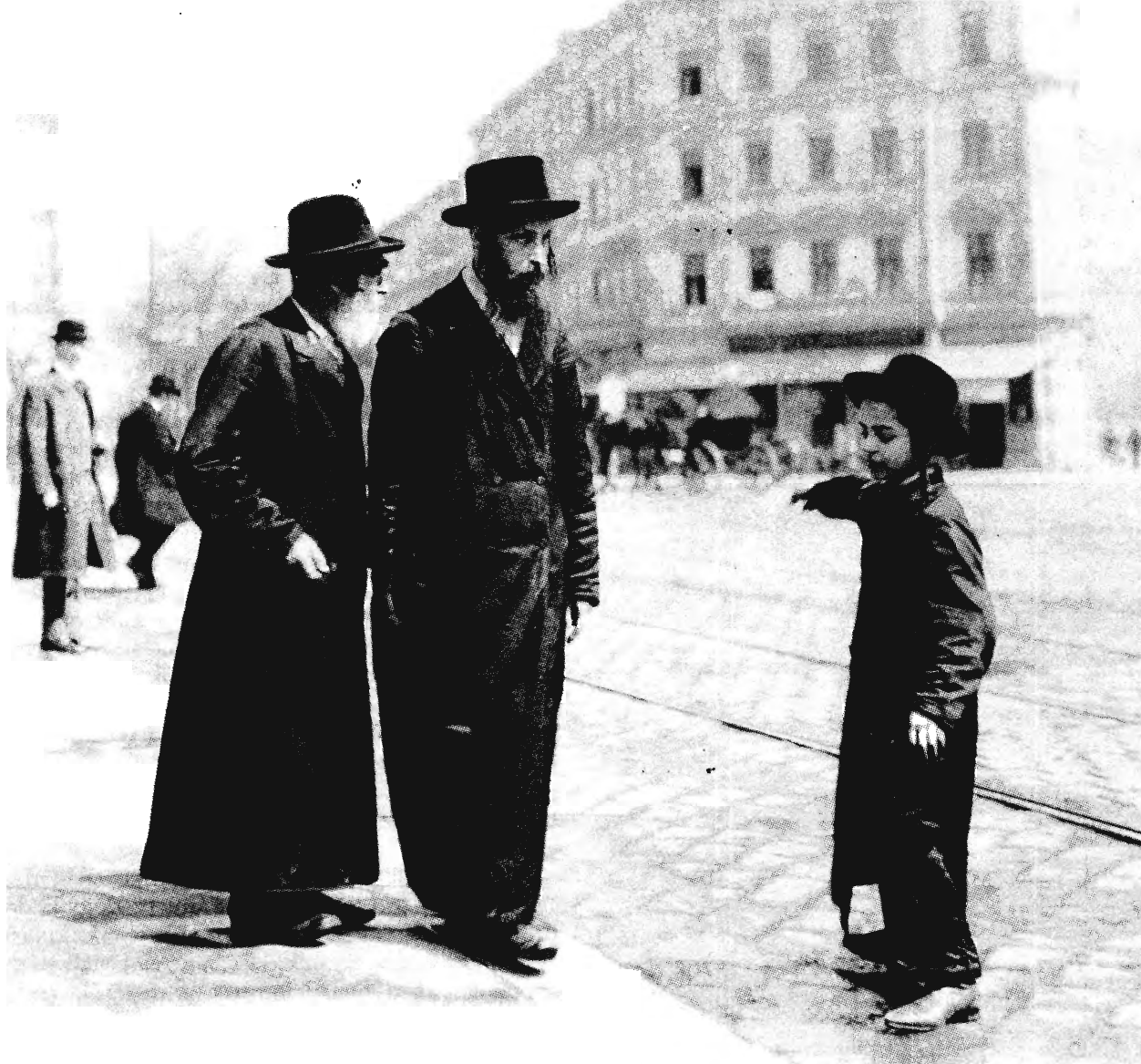
GALÍCIAI ZSIDÓK BÉCSBEN 1915.

egyik szónok: „A zsidóktól mint nemzettől mindent meg kell tagadni; mint egyéneknek mindent meg kell adni nekik. Állampolgárokká kell lenniük. Felvetődött a kérdés, hogy netán nem akarnak állampolgárok lenni. Ha ezt mondják, ám legyen száműzetés az osztályrészük. De nem lehet nemzet a nemzeten belül.” Valójában a zsidók vallási közösségekben való különállását hivatalosan elismerték Franciaországban és más európai országokban is; e közösségekben a rabbik – az állami irányítás alatt hatalmuk legnagyobb részétől megfosztva – a szellemi vezetés funkcióját gyakorolták továbbra is. A rabbik új szerepe a keresztény klérus mintáját követte. Az állampolgárság elnyerése s a szegregáció kényszerének megszűnése azonban az egyént életbevágóan fontos döntés elé állította. Ettől kezdve minden zsidónak magának kellett eldöntenie, milyen mértékben akarja megtartani zsidó identitását, s milyen módon kívánja ezt kifejezésre juttatni. Ha a zsidók egy csoportja úgy döntött, hogy hátat fordít az új lehetőségeknek, s mintegy újjáépíti a ledőlt gettófalakat, ezt megtehetette – az állampolgársággal járó kötelezettségek hatá-