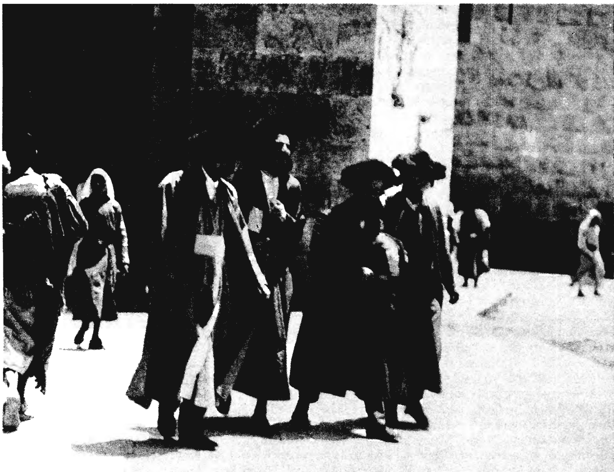
HASZIDOK A 30-AS ÉVEK JERUZSÁLEMÉBEN

államtól. A judaizmust széles körben elismerik, mint a nagyobb vallások egyikét, s teljes mértékben tiszteletben tartják. Tulajdonképpen bizonyos társadalmi nyomás nehezedik a zsidókra – éppúgy, mint az amerikaiakra általában –, hogy csatlakozzanak valamely vallásos közösséghez. Ugyanakkor a sok különböző nemzeti kisebbség léte a zsidó identitásnak esetleg egy másfajta szemléletéhez vezethet, amelyben a vallás a társadalmi és kulturális szempontok mögé szorul. Izraelben és a Szovjetunióban a zsinagóga vallási alkalmakra szolgál, ugyanakkor a közösségi élet központjaként is működik, s egy sor tisztán társadalmi természetű programot kínál. Hasonló a helyzet más országokban is, még ha a helyi körülmények folytán a zsidók helyét az osztálytársadalomban bizonyos fokig másként ítélik is meg. A zsidók – ha kisebbségi csoportot alkotnak – érzékenységre hajlamosak, s bizonyos feszültségeket élnek át, mind csoportos, mind egyéni vonatkozásban. A zsidó képviselői szervek figyelemmel kísérik mind a törvényhozást, mind a politikai fejleményeket, amennyiben ezek a zsidó közösség érdekeit fenyegethetik, s gyakran kezdeményeznek kapcsolatokat más vallásos vagy nemzetiségi csoportokkal. Izrael a zsidó