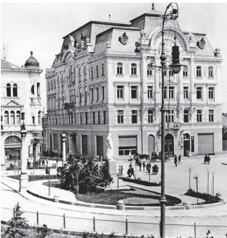
A Zsidó Nemzeti Ház épülete Csernovicban