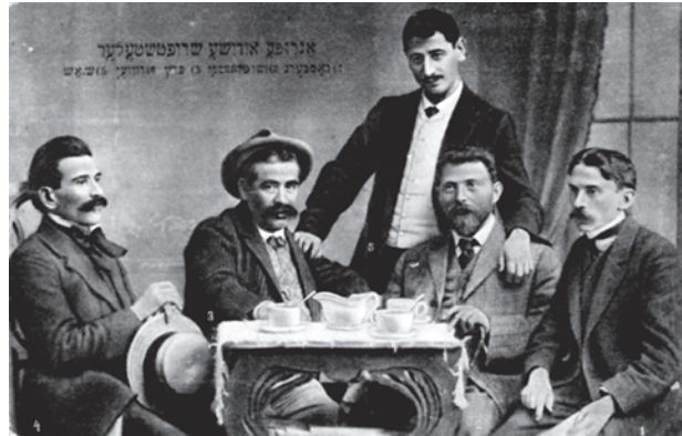
A csernovici konferencia résztvevőinek egy csoportja: (balról jobbra) Avrom Reyzen, Isaac Leib Perec, Sholem Asch, Chaim Zsitlovskij és David Nomberg

Birnbaum már 1894-ben felvetette egy cionista