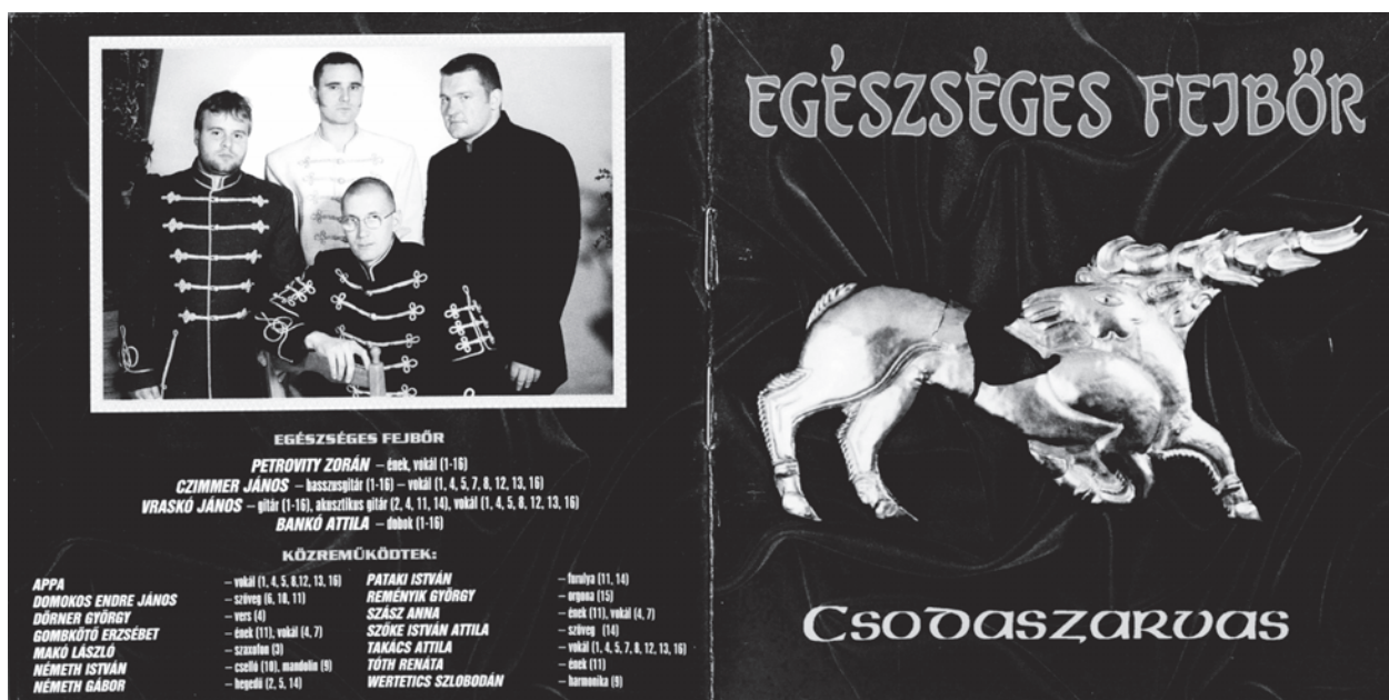
Egészséges Fejbőr: Csodaszarvas c. lemez borítója, szerzői kiadás, 1998

feltehetően 1992–93 körül keletkezett. 120 Jellemző a közvetlenül rendszerváltást követő évekre, hogy a szöveg egyébként nyilvánvaló antiszemitizmusa csak kódolt formában jelentkezik. Erdélyinek annak idején nem okozott gondot a „zsidó” főnév vérváddhoz társítása, az Egészséges Fejbőrnél azonban a közérthető „Tiszaeszlár” és „Solymosi Eszter” hívószavak és a többes szám harmadik személyű igék mellett („mit tettek”, „ölték meg”) a legdirektebb megnevezés a „választott nép” és a „vérengző gyilkos vadak”. 121 A dal hangneme mindazonáltal a kódolt fogalmazásmód ellenére is agresszívabb, mint például a Sakterpolka kedélyes úri antiszemitizmusa: „Hogyha ők, nem üvöltének : merre van Tiszaeszlár.” [Kiemelés tőlem – V. D.] Más ugyanis egy szélsőjobboldali együttes célközönsége, mint egy tizenkilencedik század végi társas összejövetel. Maga a dalszöveg jóval rövidebb, mint a költemény: négy, négysoros versszakból áll, lényegében Erdélyi verséből kiragadott kifejezések, sortörések újrarendezése, kiegészítve új elemekkel.