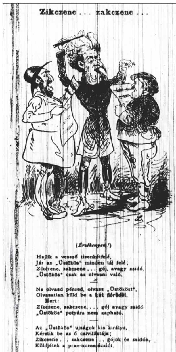
Az Üstökös előfizetési felhívása. 1883. 10. 07., 11. (első közlése: 1883. 09. 23., 11.)