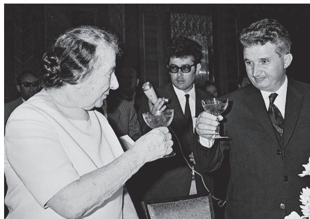
Golda Meir és Nicolae Ceaușescu

A propaganda célcsoportja, az Egyesült Államok döntéshozói, évről évre egyre szkeptikusabban szemlélték a Ceaușescu-rezsim zsidópolitikáját. Az amerikai politikai életben egy jól elhatárolható szakadás jött létre Románia MFN-státusa kapcsán. Míg a Fehér Ház és a State Department – a külpo-