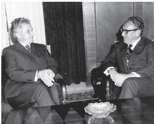
Nicolae Ceaușescu és Henry Kissinger