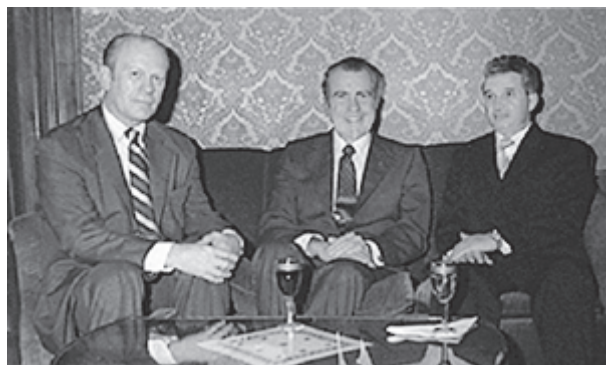
Gerald Ford, Richard Nixon és Nicolae Ceaușescu

1948 után Románia a Szovjetuniótól függő vazalusszerepbe süllyedt, ezért a Román Kommunista Párt gazdasági, társadalompolitikai és külpolitikai döntéseiben a Szovjet Kommunista Párt vezetőinek az „útmutatásait” követte. Ez az alárendelt szerep azonban 1958-ban oldódni látszott. A Szovjetunió, engedve Gheorghe Gheorghiu-Dej (1901–1965), a Román Kommunista Párt főtitkára kérésének, kivonta a Romániában állomásozó csapatait, széles manőverezési pályát hagyva a főtitkárnak. Dej így