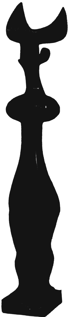
JAKOVITS JÓZSEF SZOBRA

a tapasztalás „őbenne” van, s nem közte és a világ között.