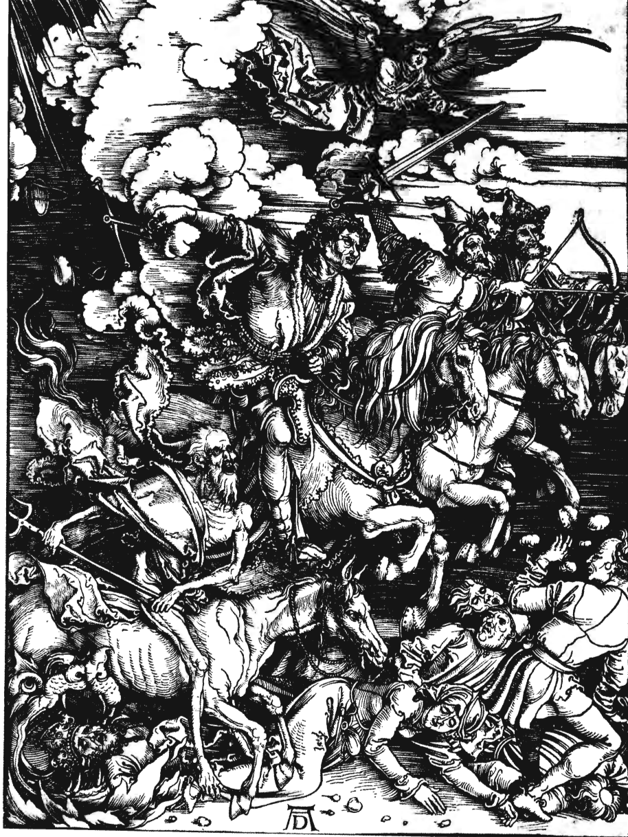
DÜRER: APOKALIPSZIS 16 LAP