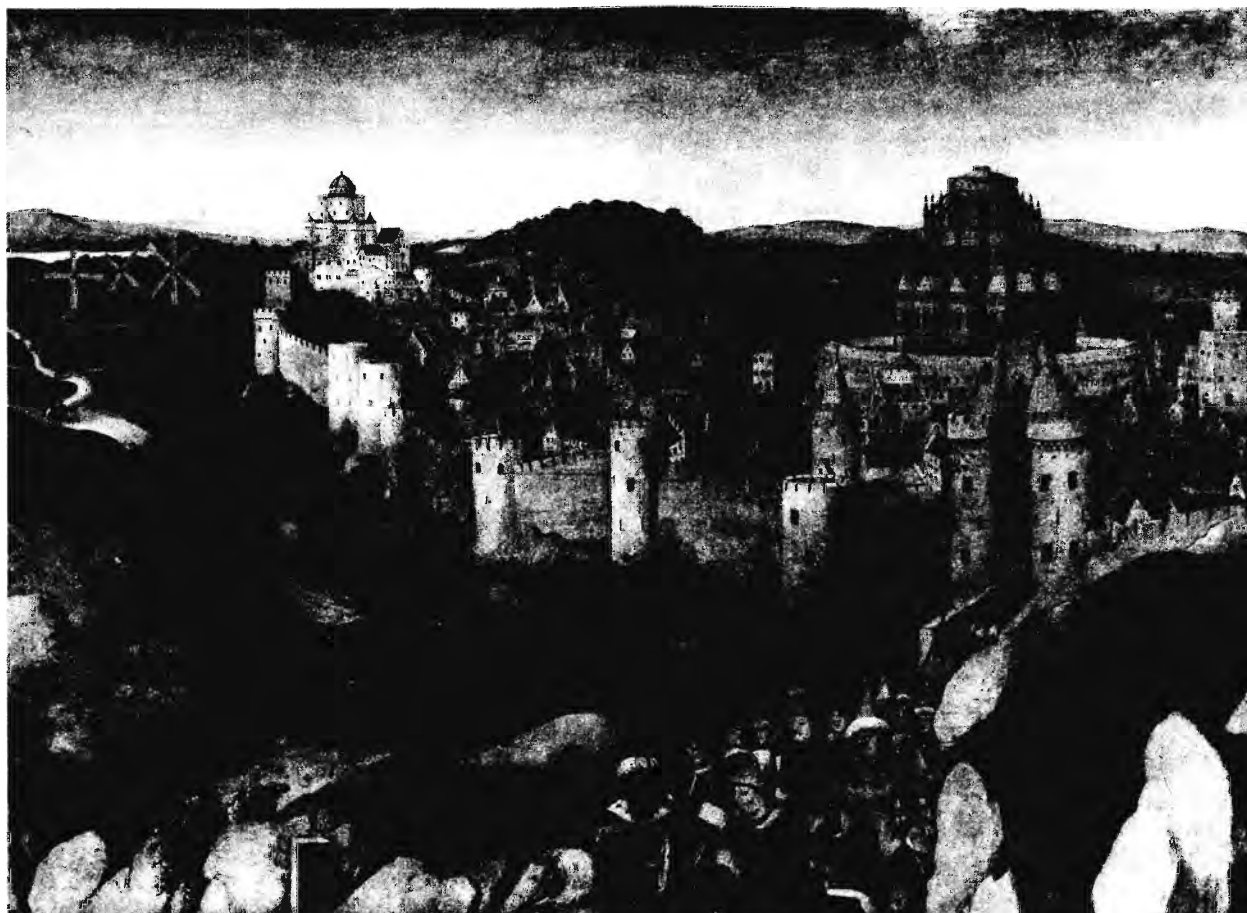
Y. VAN EYCK UTÁNI MÁSOLAT: JERUZSÁLEM (RÉSZLET)

vallástokban, hanem csak az igazat mondjátok Allahról. A Messiás Jézus, Mária fia, Allah küldötte és az ő Máriába helyezett igéje, és Alláhtól való Lélek. Higgyetek hát Allahban és az ő Küldöttében, és ne mondjátok: Három. Álljatok el ettől, jobb lesz nektek. Allah csak egyetlen Isten.” Zsidónak persze tilos belépni erre a helyre, hiszen itt volt a salamoni templom, a Szentek Szentje , ahova a főpapot kivéve senki sem léphetett be, ő is csak egyszer egy évben, hogy az alapkövön állva a jelenlevő Isten színe előtt bemutassa az illatáldozatot. Hogy az izraelitáknak (ahogy magukat nevezték, s őket a pogányok zsidóknak) mit jelentett, mit jelenthetett a Templom, azt Lukács evangéliumából is tudni, mely szerint Mária és József a hétnapos ünnep egész idejére Jeruzsálemben maradt, s velük a tizenkét éves Jézus , hogy az ószövetségi törvényt teljesítve Jeruzsálemben imádhassa istent. „Minden nemzet Jeruzsálembe jön a sátoros ünnepekre” – írja Zakariás (14,8 és 16.). „Tapadjon számhoz a nyelvem, ha nem emlékezem meg rólad, Jeruzsálem” – hangzik a Zsoltárok könyvében (13,6.6.). A Templom árnyékában Jeruzsálemben kb. 400 zsinagóga volt Jézus korában.