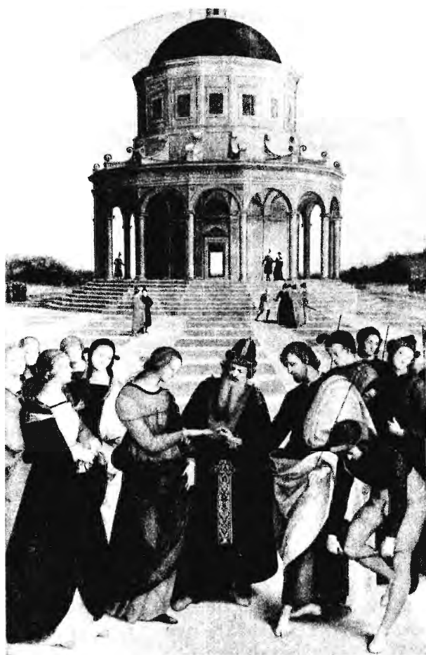
RAFFAELLO: MÁRIA ES JÓZSEF ELJEGYZESE

ség tán nagyobbik fele fölé magasodó valóságos és szimbolikus – sziklát , mely zsidóknak, keresztényeknek és mohamedánoknak egyaránt szent sziklája. Nem a Siratofalat , ahova közeledvén (s átélvén azt az élményt, hogy én leszek az első anyám családjából, aki fejemet a Falhoz érintem, s ráz a zokogás, talán a büntudat miatt, hogy én nem imádkoztam, nem sóhajtottam minden évben, mint ők, akik hitték, hogy jövőre Jeruzsálemben... s lám mégis én) próbálom elképzelni, hogy negyven méter volt a Templomfal átlagos magassága... a tekintet egybefogja a Kotelt , a Falat s fölötte a 688–691 között felépített nyolcszögletes, centrális Hárám as-Sarifot , a Fenséges Szentélyt, ahova a muzulmánok zárándokolnak. A fehér és kék márvány- és fajanszlapok s a harminc méter magas kupola messzire világít. Bent a körbe futó boltíveken figyelmeztetés a Koránból a keresztényekhez: „Ti, az Írás népe, ne esetek túlzásba