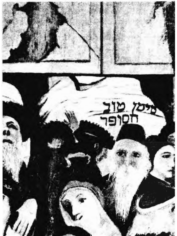
CSONTVÁRY: PANASZFAL (RÉSZLET)