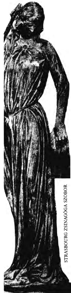
STRASBOURG ZSINAGÓGA SZOBOR

Jeruzsálem „ a város ” ősi kapukkal, amelyeket az Örökkévaló különösképpen szeret, mert ő maga erősítette meg