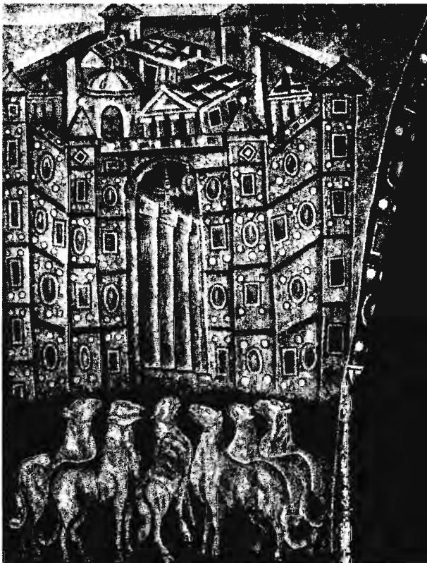
ST. MARIA MAGGIORE, RÓMA. JERUZSÁLEMI MOZAIK

597-ben bevette a várost, lerombolta a Templomot. Szörnyű kimondani, pedig így van: ezzel tette örökkévalóvá és serkentette a fogságban tartott prófétákat, költőket, látnokokat a valóságoson túli, a szimbolikus és ezért örökké létező Jeruzsálem megteremtésére. A perzsa Cirusz 539-ben meghódította Babel városát, s birodalmi tartománnyá tette, a zsidók visszatérhettek földjükre. 445-ben a szívós Nehémiás 52 nap alatt felépíti