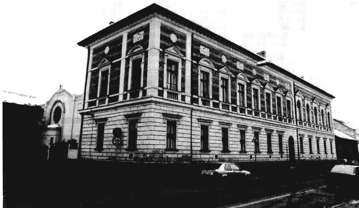
A HITKÖZSÉG ÉPÜLETE

A társasági élet szintjén a zsidóság magába zárkózása az antiszemitizmus fokozódásával egyre jellemzőbbé és szükségyszerűbbé vált. Egyre kevésbé látogatták az Arany Bika nagytermét. 1939-től fokozatosan a Kereskedelmi Csarnok vált a zsidó társasági élet fórumává.