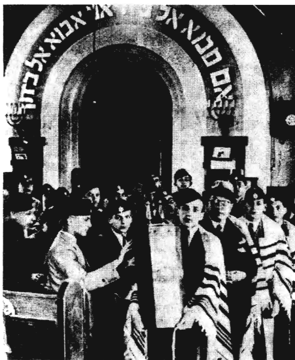
KÖRMEKET AZ EREC JISZRÁELBŐL HOZOTT TÓRATOKBAN LÉVŐ TÓRÁVAL A GIMNÁZIUM IFJÚSÁGI ISTENTISZTELETÉN

1940 novemberében egy detektív a következőket jegyezte le jelentésében a Kereskedelmi Csarnokról: „Tagjai 98 százalékban zsidók, mégpedig zsidó intellektuálisok: ügyvédek, orvosok, gyógyszerészek, ezen kívül és pedig nagyobb részben zsidó nagy- és középkereskedők, bankemberek. A Kereskedelmi Csarnokot zsidó kaszinónak is emlegetik. Tagjainak száma 200-on felül van. Hétköznapi látogatottsága átlagosan 30-40 személy, szombati és vasárnapi látogatottsága 70-100 személyig.” 58