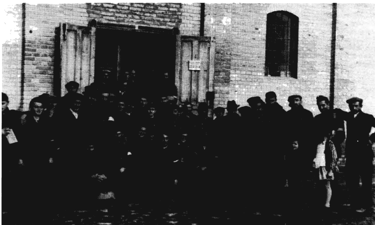
KISZOMBOR, 1940. BÚCSÚ A TÁBORTÓL

te be a cionista mozgalmak felelős posztjait (hiszen nem szabad figyelmen kívül hagyni a cionista ideológia messzemenően világi jellegét). Másik részük, mint láttuk, a kitéréssel szentesített radikális disszimulációra hajlott. Innen az 1945 utáni kitérőkre jellemző markáns „asszimiláltsági” jelzések (melyek például a magyar nevéik vagy a Budapesten születettek arányában fejeződtek ki).