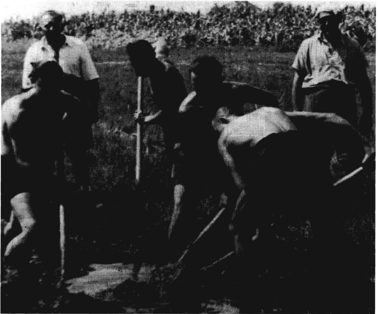
ABONY, 1940. CSATORNAÁSÁS

zó mennyiségi szinten ugyan – ugyanazt a tendenciát tükrözi. A magyar családnév felvétele mindig is az asszimilációs beállítottság egyik fontos kifejezési formája. Érthető, hogy a krízis előtti kitérők, ezek szülei és az aktusnál asszisztáló tanúk között felényi vagy ezt megközelítő nagyságrendű magyar nevűt találni. Bár erre nézve nincsenek közvetlenül összehasonlítható adataink, valószínű, hogy ezek az arányok meghaladták a rokon népességben lévő megfelelő arányokat. 28 Itt tehát minden bizonnyal szignifikáns összefüggés volt a különböző asszimilációs magatartások (kitérés, magyar név viselése) között. Ez a logikus korreláció azonban 1944-ben meglazul. Mivel a budapesti zsidóság névanyaga a régi rendszer utolsó évtizedeiben alig módosult, hiszen már az 1920-as évektől kezdve egyre nehezebben, inkább csak kivételesen engedélyezték a zsidók névmagyarosítását (például a volt kitüntetett frontharcosoknak), 29 az 1944-es csökkenést elsősorban avval kell magyarázni, hogy a pánikmozgalom szelekciós mechanizmusa immár nem a magasabb szintű asszimiláltság elvét követte, hanem számos olyan üldözöttet is magával ragadott (így például nagyszámú öreget), akiknek vallásváltása pusztán a „konjunkturális” fenyegettetés és nem a „strukturális” logikának vagy a haszonténye-