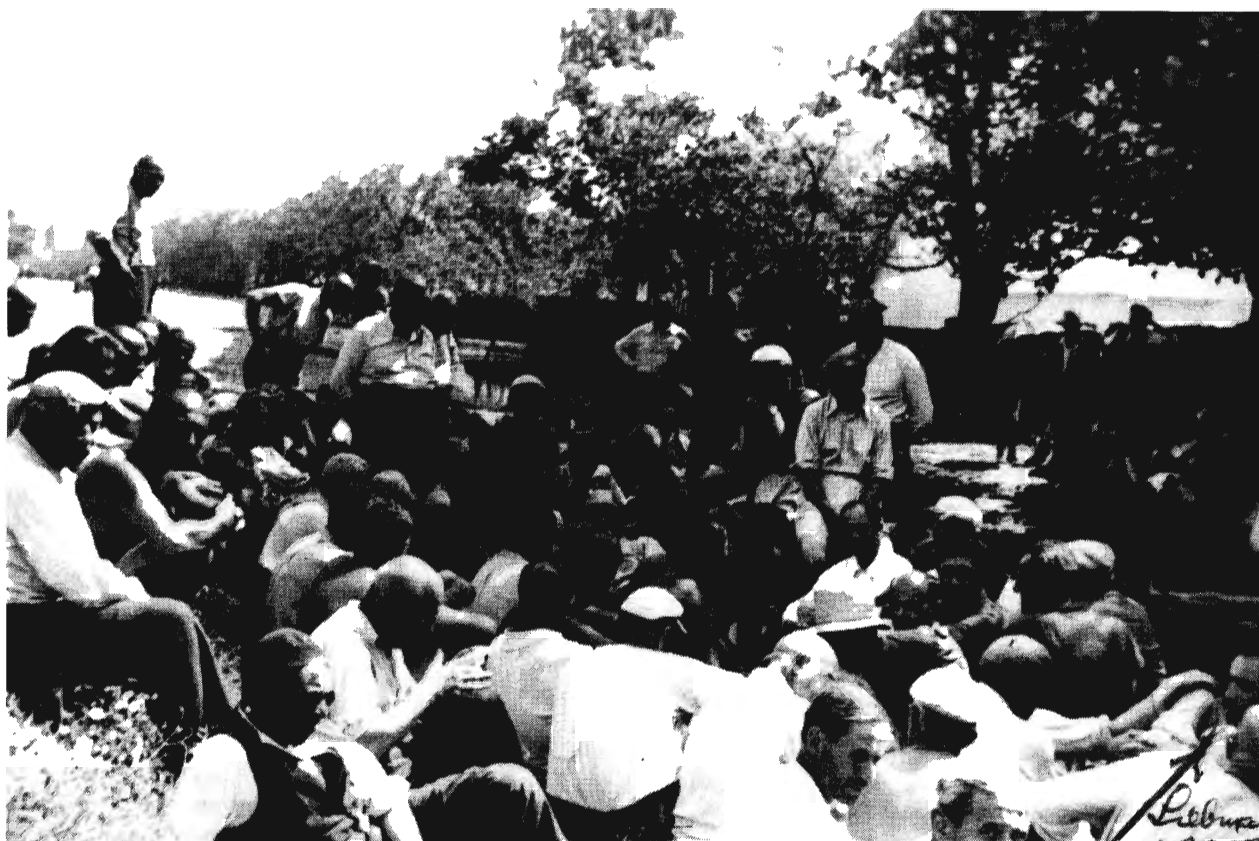
ABONY, 1940. DÉLI PIHENŐ

pest a beköszöntő új, világi beállítottságú rendszerben minden bizonnyal igen jelentősen megnőtt a kitérők között a felekezet nélkülivé válók kategóriája. Ezt egy budapesti hitközségi forrás az izraelita egyházi hivatalnál kijelentkezők egy negyedére teszi 1943–46-ra, 8 melyből a túlnyomó többség csak az utolsó két számba vett évre juthatott: az antiszemita korban a felekezet nélküli státusz a legrosszabb kitérés forma volt, hiszen a zsidóság elhagyását nem pótolta egy keresztény egyház által biztosított védettség, a kitérés legfőbb konjunkturális indoka. Ezért a zsidó származásúak a közhiedelemmel ellentétben mindig erősen alul voltak képviselve a felekezeten kívüliek között. 9 A felekezetnélküliség csak az új rendszer kérdéseinek „világi” státuszigényeit elégíthette ki. Így viszont, ha a fenti becslésből indulunk ki, a keresztény egyházközségeknél megfigyelt s az 1. táblázaton feltüntetett kitérés ráát legalább 4–6 %-kal meg kell emelnünk. 10 Ezek szerint az elengedhetetlen korrekciók szerint a fennmaradt zsidóság nagyságrendileg átlagban magasabb statisztikai gyakorisággal váltott vallást a felszabadulás első éveiben, mint a háború alatti, intézményesített antiszemita rendszer tartama alatt. A kitérés mozgalom az 1944-es pánik vargabetűje után mintegy olyan magas szinten folytatódott, ahol az előző rendszerben abbamaradt, eltekintve az antiszemita krízisévek (1938–1939, 1944) csúcserőveitől.