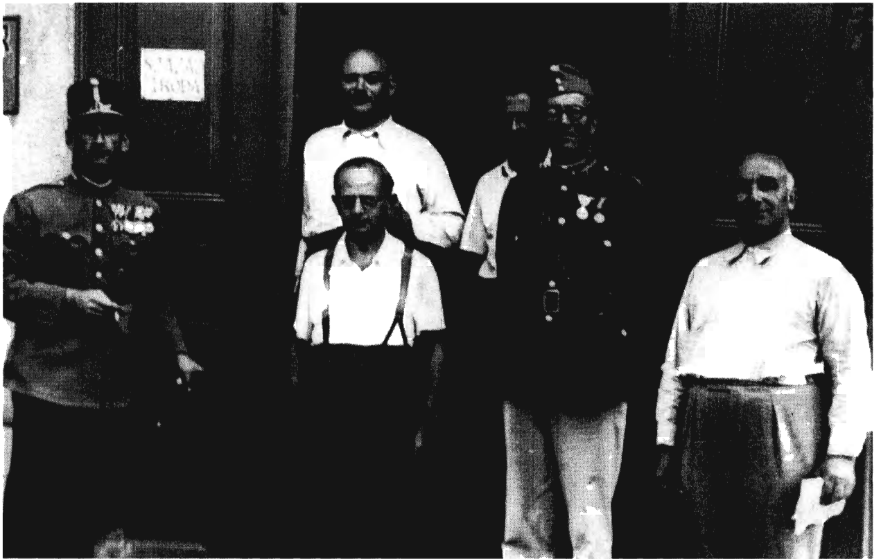
ABONY, 1940. TÁBORPARANCSNOKSÁG