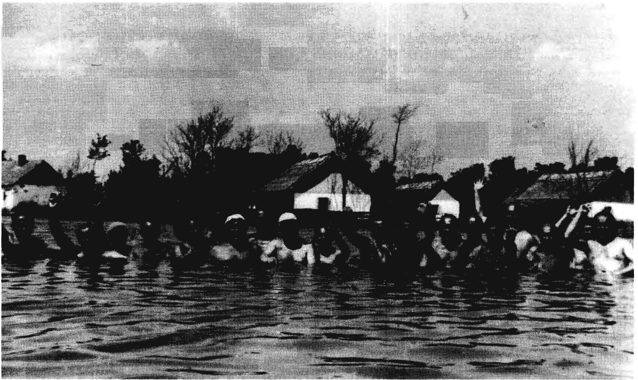
ABONY, 1940. STRANDOLÁS A LÓUSZTATÓBAN