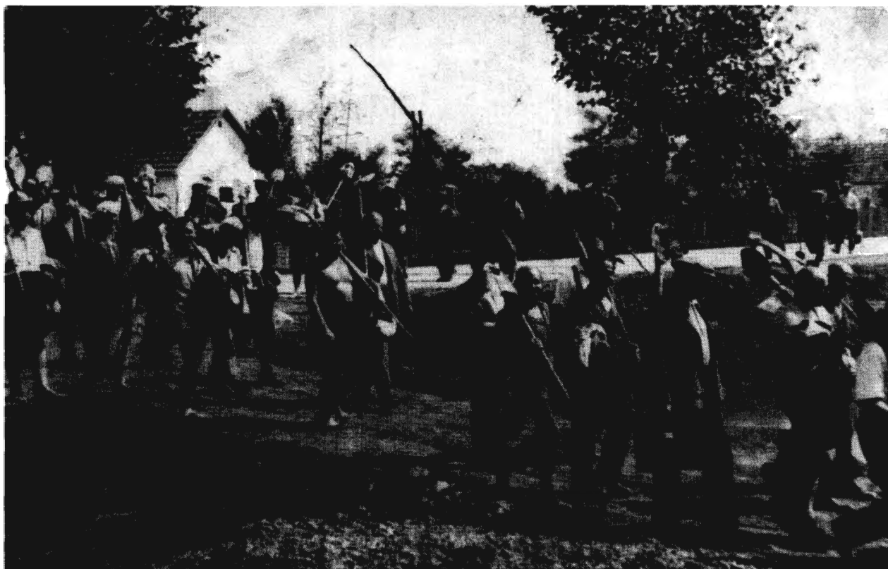
ABONY, 1940. MUNKA UTÁN

telre való tekintettel csak kis számok alkotják is a trendet, világosan kitűnik, hogy a kitérés hullám felfutása a krízist követő hónapokban következett be, és 3–6 hónappal az események után tetőzött. Ennek a látszólag elkésett reakciónak az is az oka, hogy a befogadó egyházak – a korábbi gyakorlattól magukat elhatárolandó, s az akkoriban még veszélyes templomon kívüli prozelitizmus vádját kivédendő – legtöbbször hitismereti feltételekhez kötötték, s csak bizonyos gondolkozási idő elteltével fogadták el véglegesen a betérésre való jelentkezést. A forradalmi krízis és az újabb kitérés hullám időbeli összefüggése így is egyértelműen bizonyítható. Mindez egy időben történt a magyar zsidóság egyik legnagyobb, a felszabadulás utáni évek nagyságrendjét elérő emigrációs mozgalmával... 13 A krízis felidézte traumákra tehát különbözőképpen lehetett reagálni, s a vallásváltás immár csak marginálisan érvényes magatartásként könyvelhető el, szemben a kivándorlással, a forradalmi szerepvállalással, az újabb belső emigrációval vagy a zsidó káderek egy (ugyan csökkent számú) részére továbbra is tipikus visszaintegrációval a szovjet megszállással ismét konszolidálódó hatalmi gépezetbe.