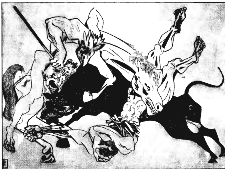
PETERDI GÁBOR: A NAGY CSATA