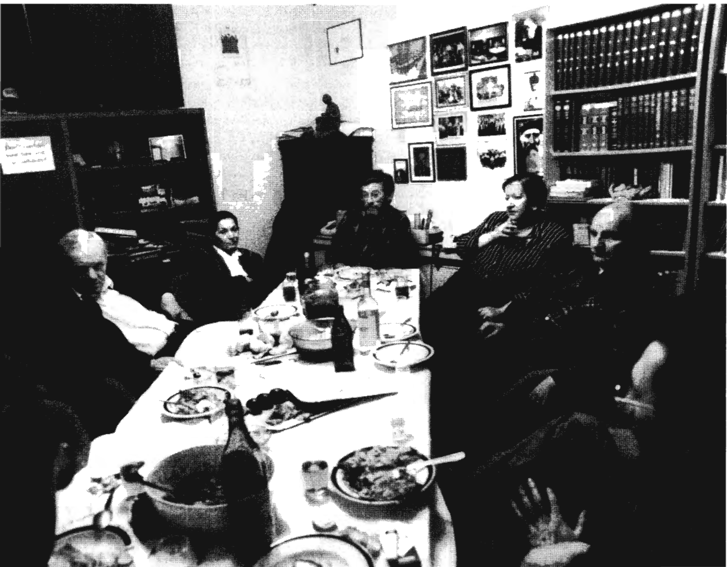
A szarajevói zsidó hitközség vezetői 1994-ről 1995-re virradóra